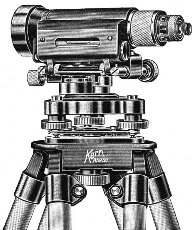
\frac{1}{3} nat. Größe

INHALTSANGABE: Die Entstehung des Übersichtsplanes, seine Nachführung und seine heutige Durchführung. Von E. Leupin, Grundbuchgeometer. — Historische Kupferstichkarten in Schraffenmanier. Von W. Kreisel, Ingenieur der Eidg. Landestopographie. — Hauptversammlung 1940 der Sektion Ostschweiz. — Buchbesprechung.