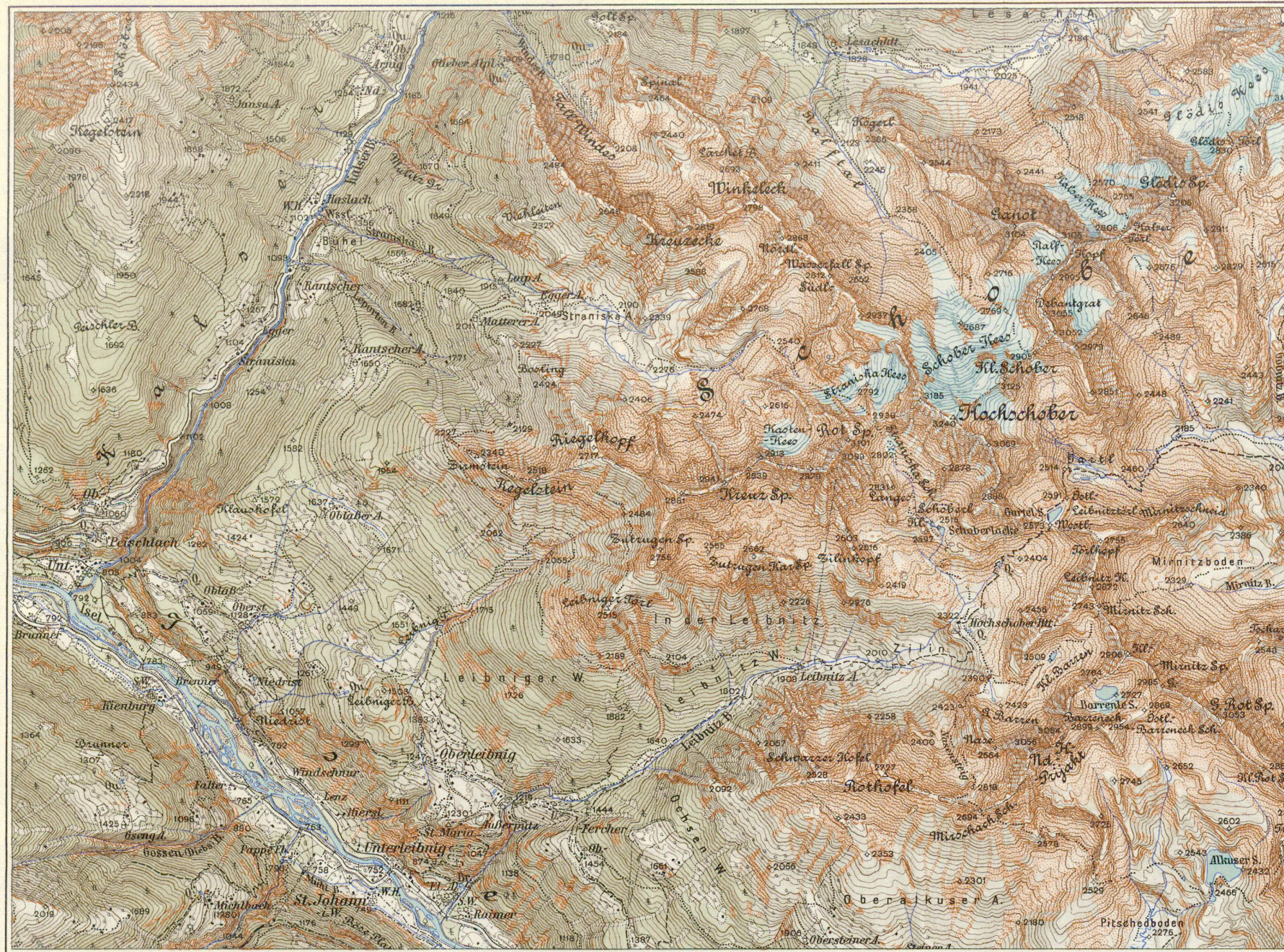
Ausschnitt aus: Österreichische Karte 1:50.000 Blatt 5249 Ost, LIENZ

Kartographisches, früher Militärgeographisches Institut in Wien