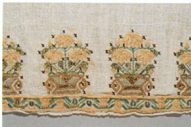
1. Serviette de bain brodée, dite havli, détail, Empire ottoman, fin du XIX e siècle | Toile de lin écrue, broderie de soie polychrome, filé riant argent (point de croix, jours à fils écartés), 74 × 70 cm (MAH, inv. AA 2008-22 [don Ninon Boissonnas, Mornex])

Au cours de l'année 2008, le Département des arts appliqués a reçu plusieurs dons remarquables, montrant l'intérêt des donateurs désireux de marquer leur attachement non seulement au Musée d'art et d'histoire, mais aussi à la Ville de Genève, par l'entrée dans les collections de divers textiles de provenance tant locale qu'étrangère.