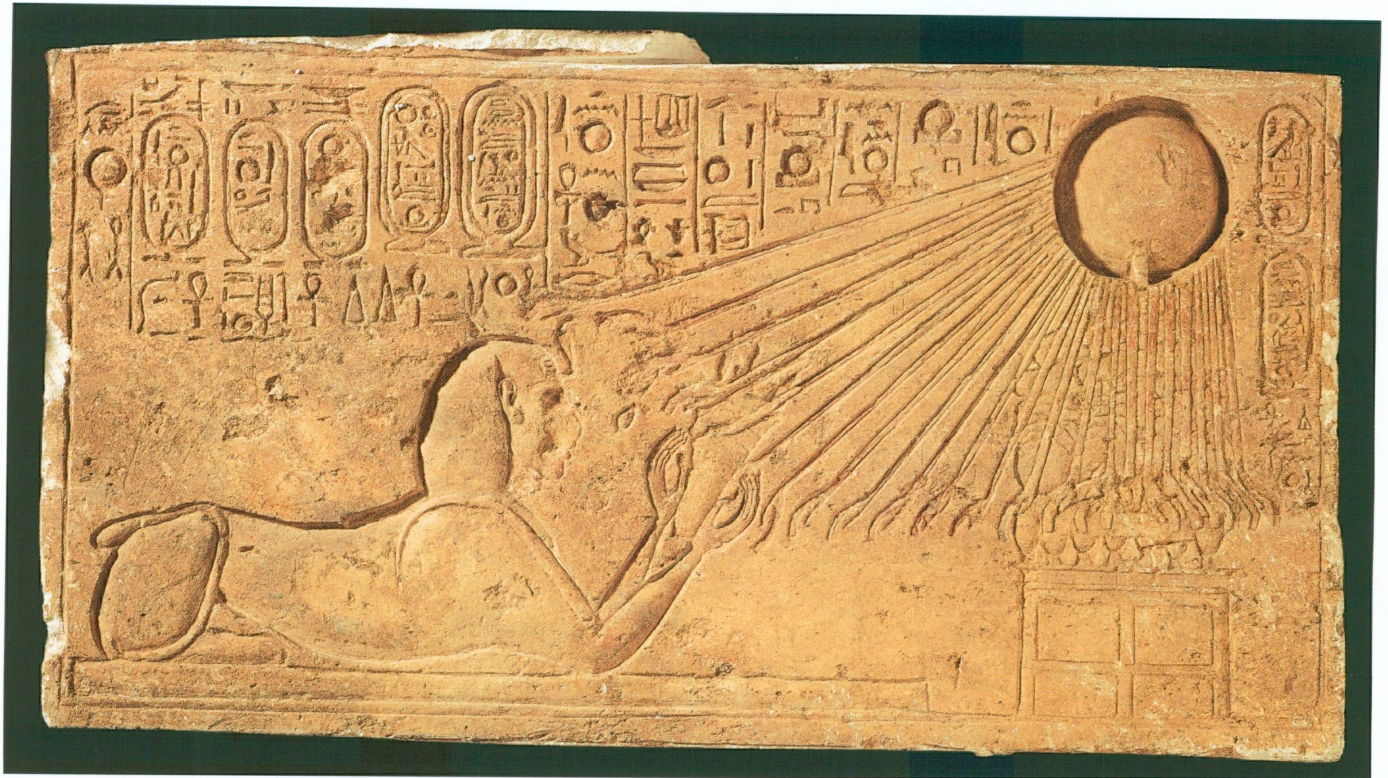
5. Sphinx adorant le soleil (linteau brisé au nom d'Akhénaton), Tell el-Amarna (?), Nouvel Empire, règne d'Akhénaton, xiv^e siècle av. J.-C. | Calcaire sculpté et peint, 52,8 × 102 cm (MAH, inv. 27804)

Cette exposition a permis de rappeler le rôle de pionnier joué par Genève dans le domaine de la recherche préhistorique dès le milieu du xvii^e siècle, tout en préfigurant la présentation des futures salles d'archéologie régionale. Les travaux de réfection ont commencé en novembre 2008 en collaboration avec le Service des bâtiments de la Ville de Genève alors que le projet de réaménagement, lancé en 2005, a été conçu en étroite collaboration avec le Service cantonal d'archéologie et le Département d'anthropologie de l'Université de Genève.