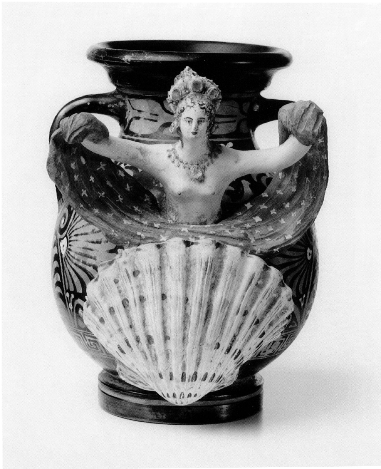
1. Péliké apulienne. Genève, Musée d'art et d'histoire 27800.