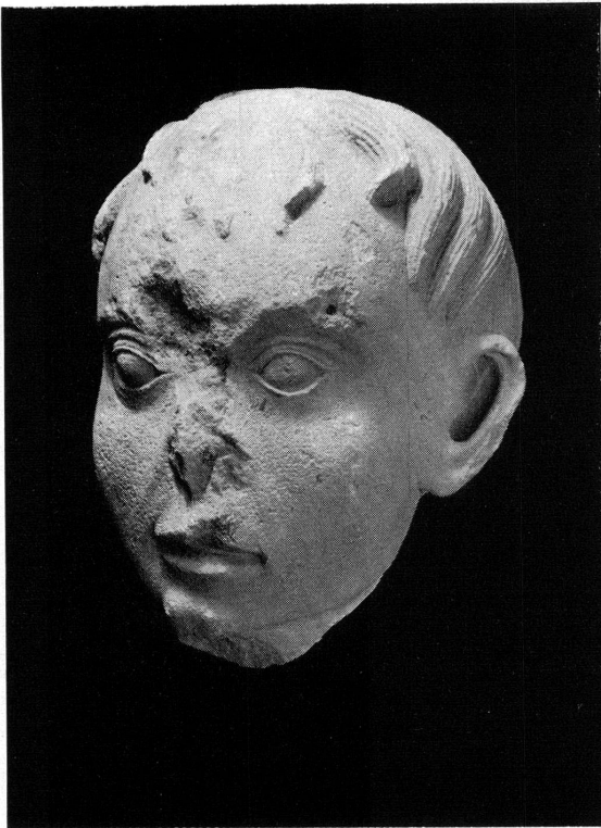
Fig. 2. Cathédrale de Senlis. Tête d'enfant provenant du portail ouest, 1185-1190.