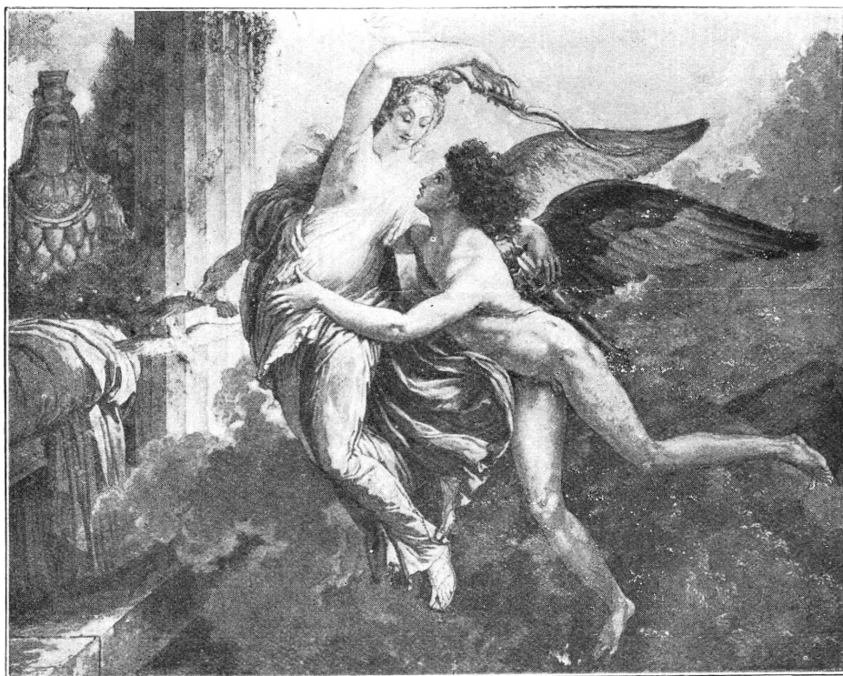
SAINT-OURS. — L'Amour entraîne Psyché vers le lit nuptial. Musée d'Art et d'Histoire.