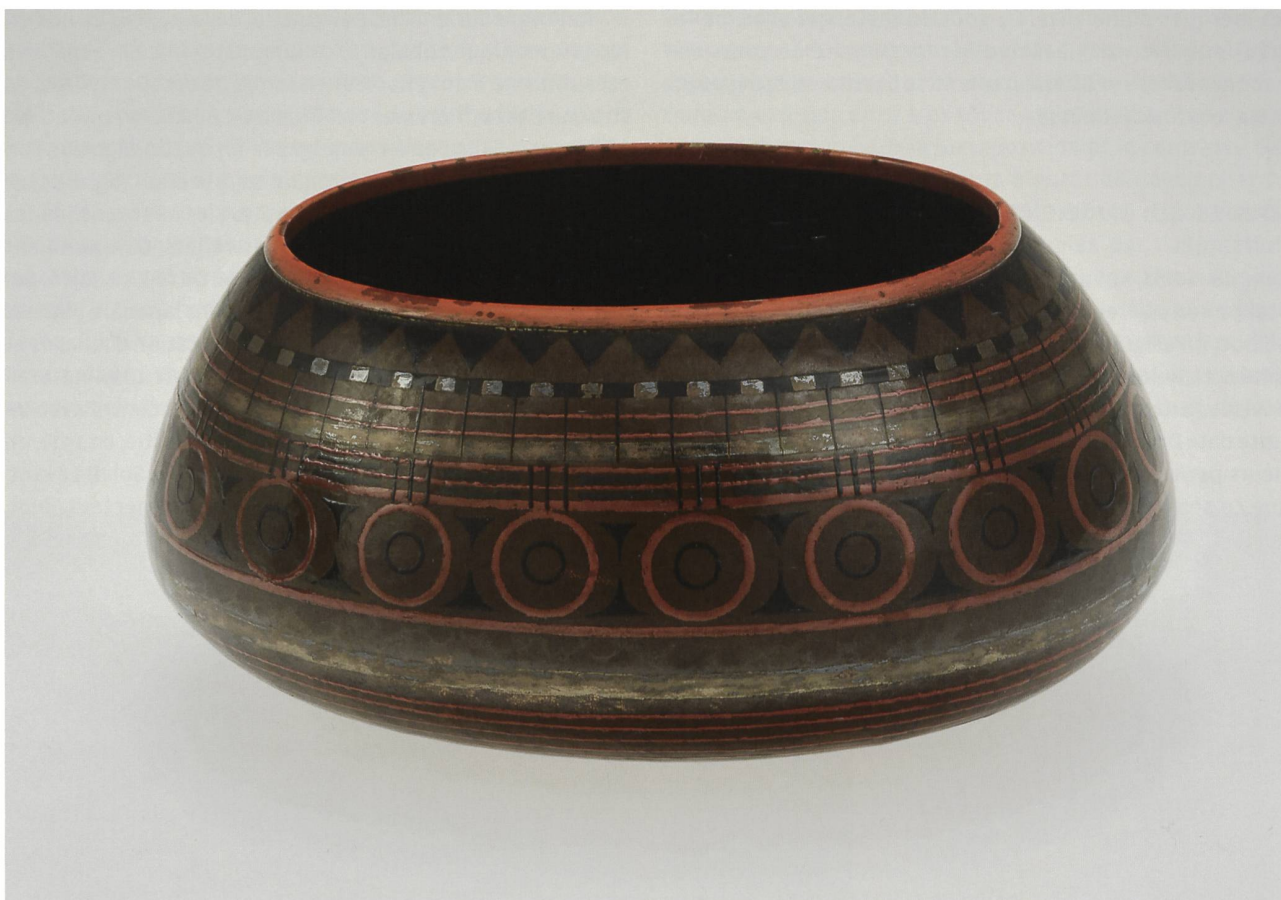
8 Jardinière, Paris, 1925. Cuivre rouge à décor laqué, haut. 9 cm, long. 18,6 cm, larg. 13,4 cm. MAH, inv. AA 2016-73.

instiller de la poésie. En dépit de l'esthétique fonctionnelle et moderniste dont témoigne de prime abord ce luminaire – se rapprochant d'ailleurs de certaines créations de Jean Perzel (1892-1986) 13 –, l'univers lyrique de l'artiste s'y exprime bel et bien. Fidèle à la nature, il offre ici une version stylisée d'une tulipe et confère à cet objet utilitaire une fascinante présence.