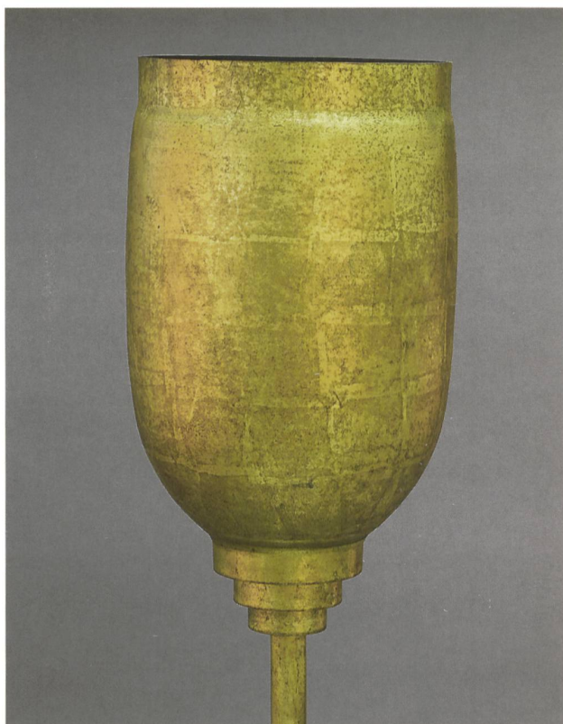
5 Lampadaire «tulipe», Paris, 1930. Cuivre martelé et doré à la feuille, pied en laiton doré à la feuille, haut. 183 cm, diam. du réflecteur 27,5 cm. MAH, inv. AA 2016-78.