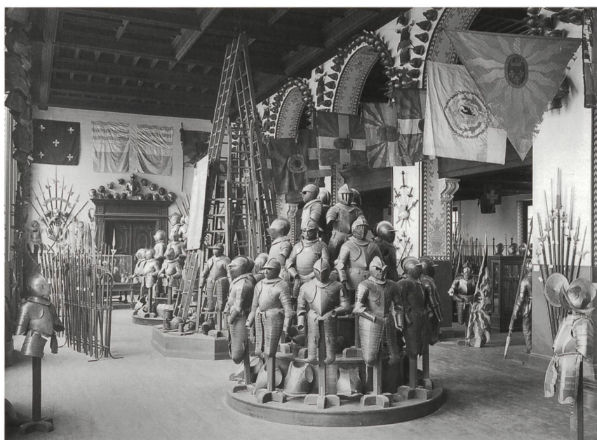
7 La Salle des Armures du Musée d'art et d'histoire, entre 1913 et 1915.

En octobre 1907, on procède au démontage du plafond en menuiserie ornant une partie de l'ancienne Salle des Armures à l'arsenal, qui sera restitué et complété aux dimensions de la nouvelle salle du Musée d'art et d'histoire 32 . Celle-ci est livrée à Galopin dès le début de l'année 1909, c'est-à-dire environ quinze mois avant l'inauguration officielle. Son aménagement commence courant février par « un premier convoi d'armures, d'armes en râteliers ou emballées en caisses », les transports de l'ancien arsenal au nouveau musée se succédant à intervalles irréguliers jusqu'en décembre. À la fin de l'année, la grande salle est « presque entièrement installée,