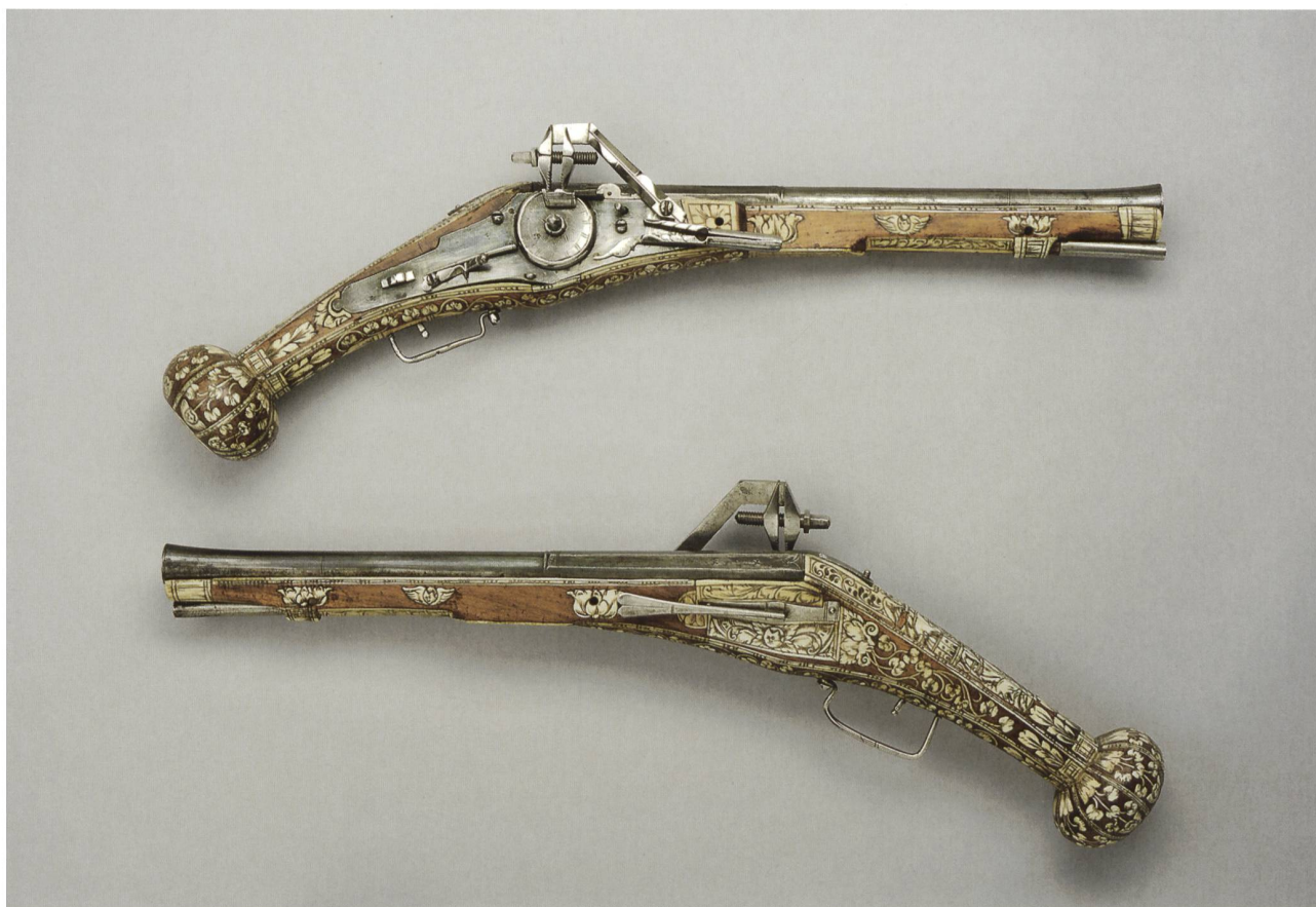
6 Paire de pistolets à rouet, Allemagne du Sud, vers 1575. Acier, bois, os; long. 57 cm, poids 1920/1860 g. MAH, inv. A 7 et A 8.

Un petit nombre de témoins iconographiques permettent de compléter ces descriptions (fig. 4 et 5) : comme jadis, les solives du plafond sont garnies de morions et de cabassets en rangs serrés, tandis que l'espace des murs est presque entièrement occupé par des alignements de casques et de cuirasses. On y retrouve également les compositions décoratives en « panoplie » déjà présentes au Palais de Justice, dispositif scénographique récurrent des présentations muséales de l'époque. Au fil des ans, d'autres aménagements sont apportés, dont l'installation régulière de nouvelles vitrines, indispensables à la préservation et à la bonne conservation des objets, et plus spécialement des pièces de valeur ou d'importance historique 25 . C'est donc avec satisfaction qu'en 1901 le successeur de Gosse, (Jean-)Louis Bron-Dupin (1849-1903), peut écrire qu'a été mise sous verre « la précieuse collection des pistolets 'de Pinchat' », qui est « une curiosité rare, car aucun musée ne possède un nombre aussi considérable de pistolets à rouet de cette époque » 26 . Même si la provenance historique de ces pièces est à nuancer, il n'en demeure pas