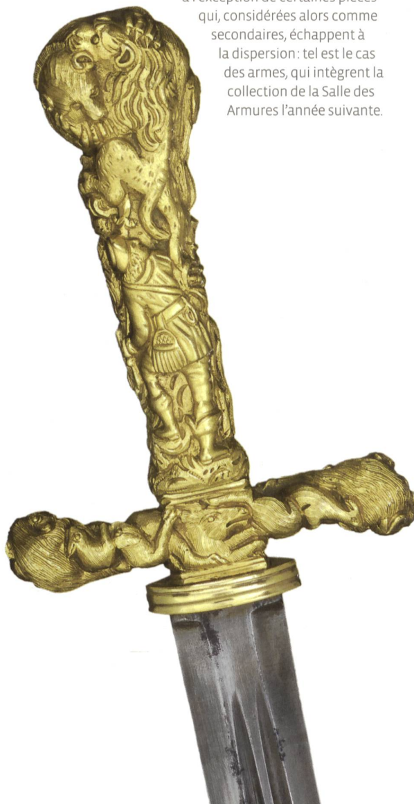
9 Couteau de chasse, Allemagne, vers 1850-1860. Acier, laiton, or, cuir, bois ; long. 60,5 cm, larg. de la garde 9,3 cm, poids 556 g. MAH, inv. B 210 ; legs duc de Brunswick, 1874. En 1871, le duc Charles II de Brunswick (1804-1873) avait institué la Ville de Genève, où il s'était réfugié une année auparavant, légataire universelle de tous ses biens. À sa mort, ceux-ci sont rapidement vendus, à l'exception de certaines pièces qui, considérées alors comme secondaires, échappent à la dispersion : tel est le cas des armes, qui intègrent la collection de la Salle des Armures l'année suivante.

Parallèlement à sa mission de conservation du patrimoine local, la collection des armures et des armes anciennes du musée, enrichie au fil des décennies par le biais d'acquisitions, mais aussi grâce à de nombreux legs et dons – émanant, pour certains, de personnalités qui ont marqué l'histoire genevoise (fig. 9) –, est aujourd'hui en mesure d'offrir au public un large panorama de l'évolution de l'art de l'armurerie en Occident, du Haut Moyen Âge au XIX e siècle, au sein duquel se distinguent de nombreuses pièces exceptionnelles, que ce soit par leur intérêt historique, leur rareté ou leur qualité artistique (fig. 10). |