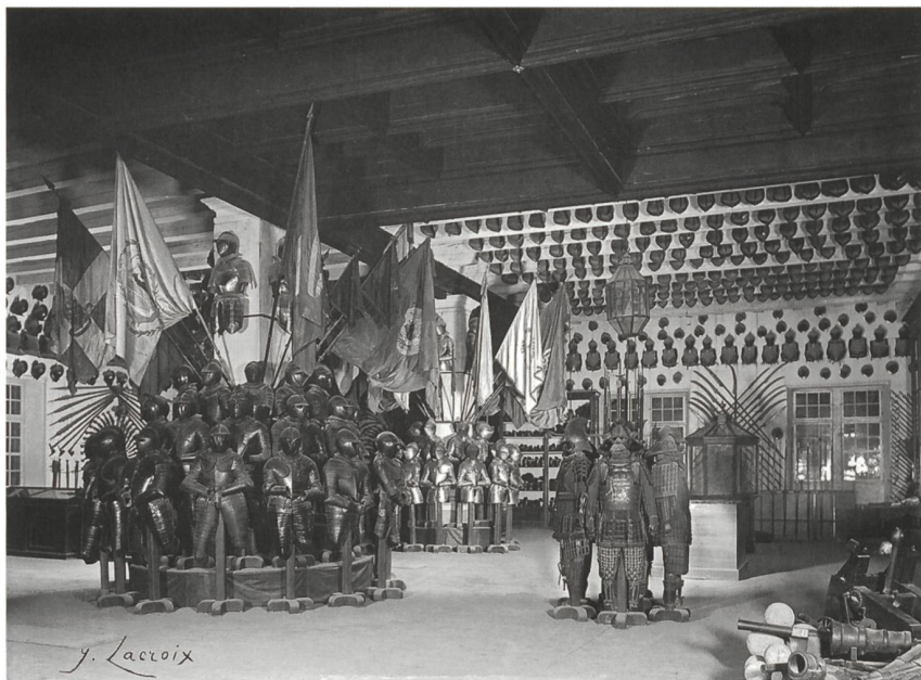
5 La Salle des Armures de l'ancien arsenal, vers 1900. MAH, inv. Bat 11. Les armures orientales visibles au premier plan font partie du lot de 132 pièces déposé en 1901 par la Salle des Armures à la villa Plantamour du parc Mon-Repos, annexe du Musée archéologique où sont alors transférées les collections ethnographiques.

interrompu depuis plus de deux siècles. L'un de ces groupes est formé par des cuirasses genevoises, l'autre par les armures des Savoyards tués dans la nuit de l'escalade. Leur couleur noire et certains détails d'exécution empêchent de les confondre avec celles du parti voisin». S'y trouvent également les échelles, «dressées comme elles l'étaient au moment de l'assaut», l'épée dite de Brunaulieu, le casque du pétardier Picot. «Des casques d'un travail précieux» couvrent la table sur laquelle fut signé en 1584 le traité de combourgeoisie avec Berne et Zurich 22 , tandis que de nombreux drapeaux au plafond «égaient la salle par leurs vives couleurs». Les parois enfin sont ornées de trophées variés, composés de pistolets à rouet «artistement disposés en façon d'éventail ou d'étoiles», de boucliers, d'armes blanches et d'armes d'hast. En guise de conclusion, l'auteur exprime «le vœu que le changement de local projeté ne soit pas trop désavantageux à cette intéressante collection qui, grâce aux soins de M. Gosse, nous paraît digne aujourd'hui d'attirer la curiosité du public et l'attention des connaisseurs».