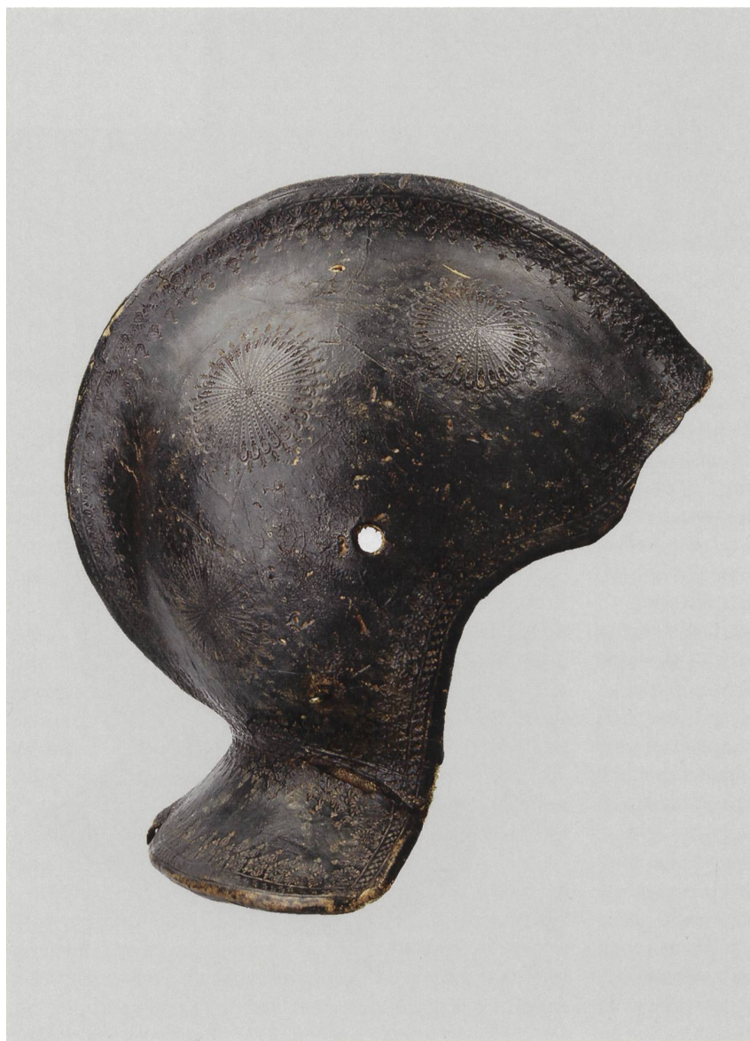
2 Armet, Italie, vers 1590. Cuir, tissu, laiton, fer, papier; long. 30,5 cm, larg. aux tempes 20 cm, poids 880 g. MAH, inv. C 912. Ce rarissime armet de parade en cuir et tissu était probablement complété à l'origine par une mentonnière-gorgerin, pièce mobile protégeant les tempes, la partie inférieure du visage et le cou.

des années tous les musées et arsenaux de l'Europe et les plus importantes collections d'amateur », mentionne à propos des arsenaux suisses qu'« il n'y a que ceux de Genève, de Soleure, de Lucerne et de Berne qui possèdent ce qu'on peut appeler une collection d'armes anciennes ». Parmi les dix pièces représentatives de la collection genevoise qu'il choisit de reproduire dans son ouvrage s'en trouvent cinq rattachées à l'Escalade et une autre, rarissime – « la seule arme de ce genre que l'auteur connaisse » –, à savoir le timbre d'un armet de parade en cuir et tissu, orné de petits motifs au fer à dorer, vraisemblablement fabriqué en Italie à la fin du XVI e siècle 14 (fig. 2).