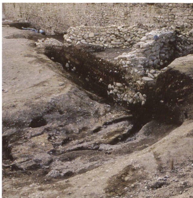
2 Le cours du ruisseau mis au jour à l'emplacement du parking de Saint-Antoine.

Les observations anciennes témoignent d'une fréquentation des lieux depuis le Néolithique (4000-2000 av. J.-C.). En se basant sur des textes médiévaux, le premier archéologue cantonal genevois, Louis Blondel, postule l'existence de trois mégalithes ; deux d'entre eux sont situés à proximité de la voie des Crêts de Saint-Laurent 6 . Un quatrième (fig. 3) est apparu en 1987 lors de la fouille de la cour de l'ancienne prison. Long de 2,4 m et orné de 18 cupules, il était basculé dans le comblement d'un puissant fossé du I er siècle av. J.-C. Ces observations suggèrent la présence d'alignements mégalithiques en bordure septentrionale du plateau. Louis Blondel signale par ailleurs dans ce secteur la découverte de plusieurs objets dont la datation s'échelonne entre le Néolithique et le Hallstatt, ainsi que d'une quantité importante de céramique de La Tène finale 7 . Au sein de cet inventaire disparate, il attribue une interprétation culturelle à la mise au jour, en 1872, d'une hache de l'âge du Bronze au voisinage d'un des captages médiévaux de la source des Crêts de Saint-Laurent, située en contrebas de Saint-Antoine 8 .