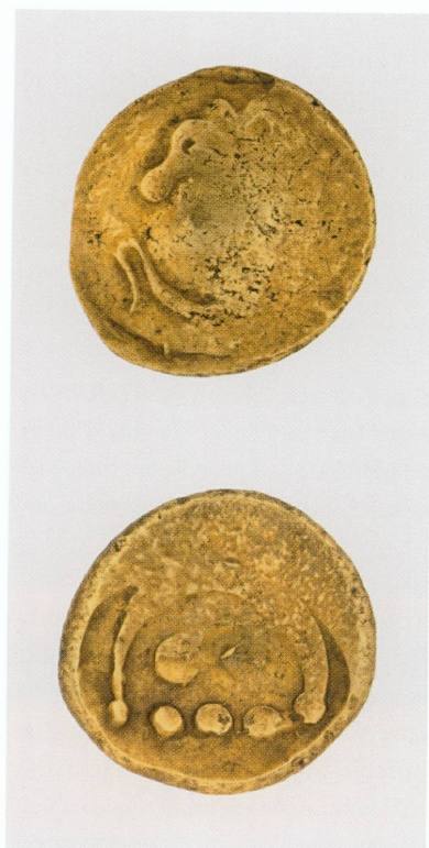
4. Statère du type Regenbogenschlüsselschen , Allemagne du Sud | Or, 7,51 g, Ø moyen 18,5 mm (MAH, inv. CdN 6846) | «[...] une monnaie gauloise en or, assez rare, qu'on estime avoir été frappée en Helvétie» ( Compte rendu de la séance du Conseil municipal , 2 octobre 1883) · LA TOUR 1892, n° 9421