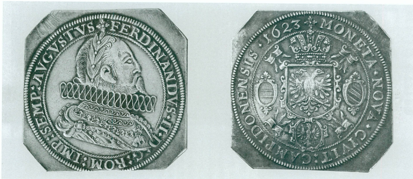
7. Kempten, Ville impériale, Klippe d'un demithaler, 1623 | Argent, 8,79 g, 36,1 × 35,1 mm (MAH, inv. CdN 19357) | « Les séries allemandes renferment des raretés de premier ordre. » ( Compte rendu de la séance du Conseil municipal , 2 octobre 1883)

celle de Walter Scott 10 sh. c. a. d. 12 francs 60. Comme je ne suis pas en fonds je ne lance pas dans ces prix, veut-il que je lui en achète quelques unes des dernières parues [...]» 21 .