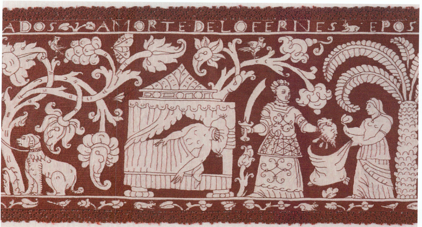
1 (en haut). Bande brodée ( Histoire de Judith et Holoferne ), Espagne, Avila (?), milieu ou fin du xvi e siècle | Lin, soie, 24,5 × 122 cm (MAH, inv. Ormond 441)