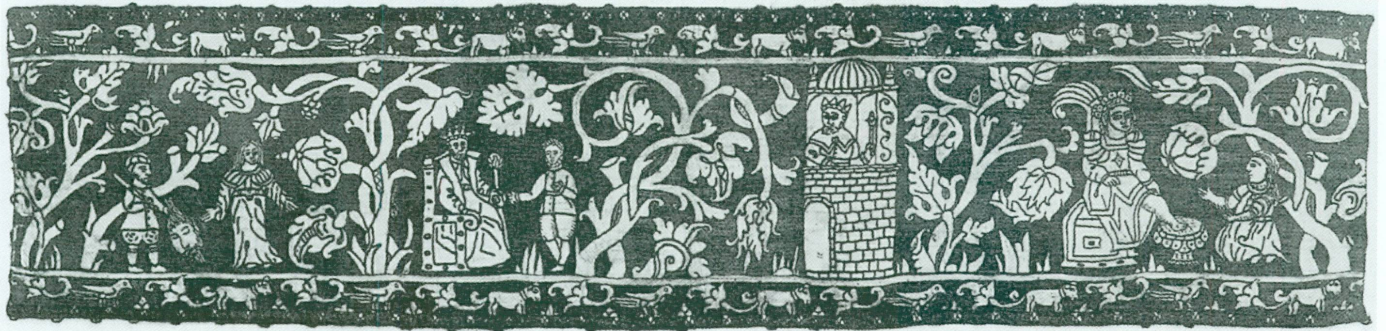
4 a-b (en haut). Bande brodée ( Histoire d'Adam et Ève ), Espagne, Avila (?), fin du XVI e siècle | Lin, soie, 20 × 180 cm (Madrid, Instituto Valencia de Don Juan) | Détails