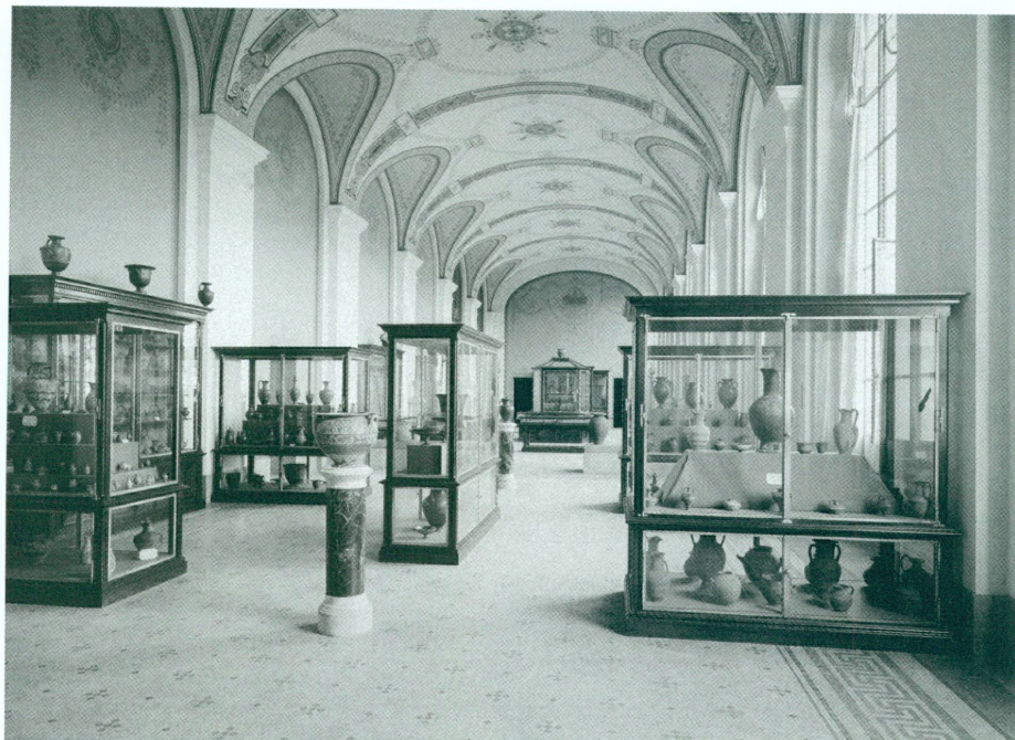
5. Salles des collections Fol et des antiquités romaines et barbares, vers 1910 | Négatif sur plaque de verre, 18 × 24 cm (MAH, Photothèque, inv. Bât. 26) | Au premier plan, vases antiques des collections Fol

chaleureusement tous ceux qui, par leur appui moral ou effectif, leurs conseils ou leurs communications, m'ont aidé efficacement, m'ont encouragé dans l'œuvre que j'avais entreprise [...]» 70 . » Nulle amertume, dans les propos de Fol ; peut-on alors vraiment prétendre que l'ouverture de son Musée fut un insuccès auprès du public ? Walther Fol a certes dû être déçu – mais comme tout homme qui a foi en la valeur de son projet – de ne pas assister à un véritable enthousiasme populaire et à un vif intérêt des scientifiques pour ses collections ; néanmoins, il nous semble qu'il n'en fut ni totalement surpris ni même découragé 71 .