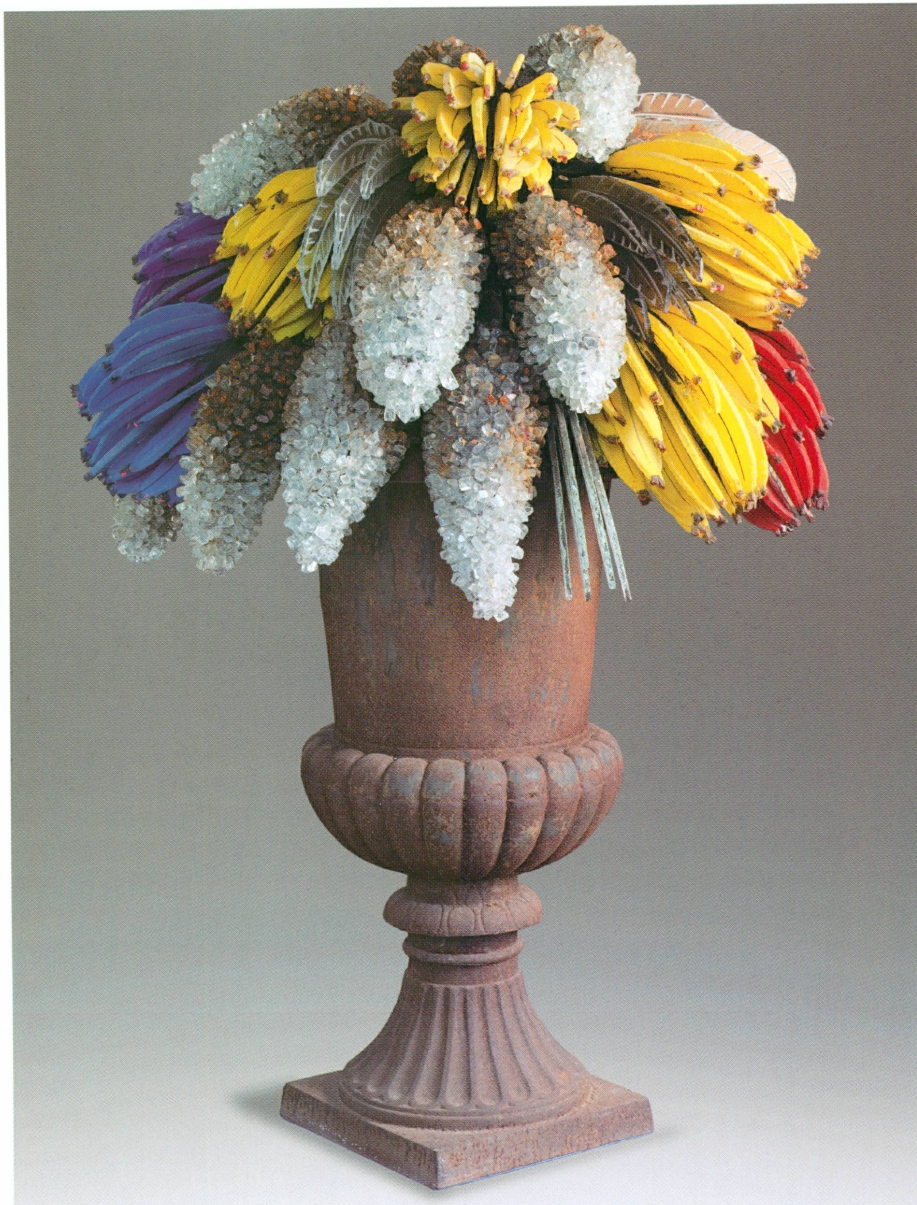
1. Marcoville (Boulogne-Billancourt, 1939) | Grande coupe de bananes et de raisins , Villejuif (Val-de-Marne), 2006 | Verre, fonte, haut. 150 cm (MA, inv. AR 2008-62 [achat])

se distingue particulièrement dans le registre de la porcelaine de Sèvres. Le « déjeuner » (inv. AR 2008-77 [fig. 4]), daté de 1768, est remarquable par sa qualité d'exécution. Il illustre de manière exemplaire les nouvelles tendances stylistiques développées par la manufacture de Sèvres dans les années 1760, avec les motifs en résille (dits « en mosaïque » à Sèvres) à dominante verte qui forment un fond sur lequel se détachent des trophées, peints avec une extrême minutie. Le décor est l'œuvre de Charles Buteux aîné (1719-1782), actif à Sèvres entre 1756 et 1782 et spécialisé dans les décors de trophées, d'armoiries, de monogrammes et de motifs « en mosaïque ».