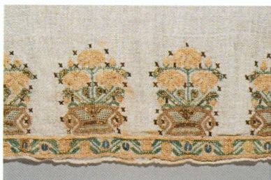
1. Serviette de bain brodée, dite havli, détail, Empire ottoman, fin du XIX e siècle | Toile de lin écrue, broderie de soie polychrome, filé riant argent (point de croix, jours à fils écartés), 74 × 70 cm (MAH, inv. AA 2008-22 [don Ninon Boissonnas, Mornex])

Au cours de l'année 2008, le Département des arts appliqués a reçu plusieurs dons remarquables, montrant l'intérêt des donateurs désireux de marquer leur attachement non seulement au Musée d'art et d'histoire, mais aussi à la Ville de Genève, par l'entrée dans les collections de divers textiles de provenance tant locale qu'étrangère.