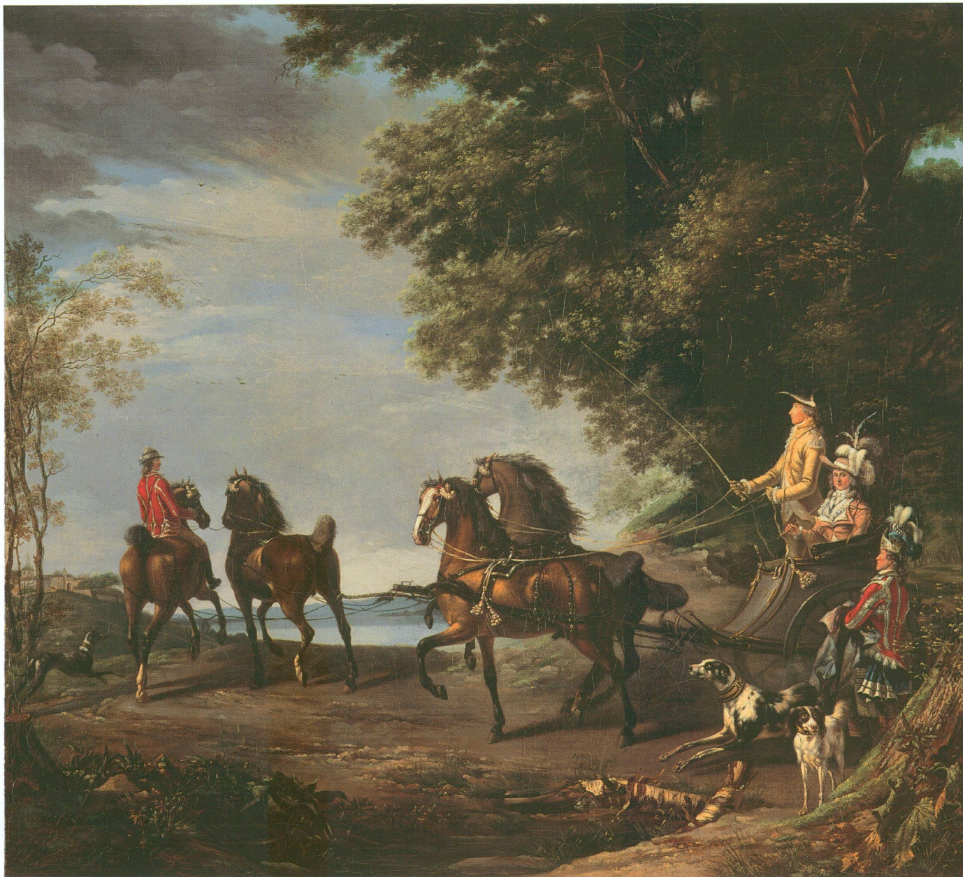
1. Louis-Auguste Brun, dit Brun de Versoix (Rolle, 1758 – Paris, 1815), Promenade du comte d'Artois et de son épouse en cabriolet , 1782 | Huile sur toile, 90 × 100 cm, signé et daté en bas au milieu : « Brun 1782 » (MAH, inv. BA 2008-197 [dépôt de la Fondation Jean-Louis Prevost, Genève])