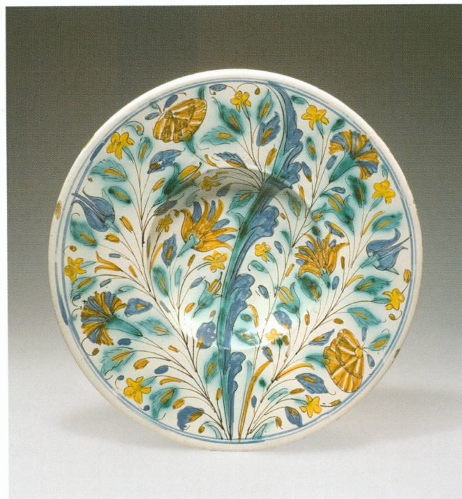
6 (à droite). Vénétie | Plat, 1650-1680 | Faïence, décor de grand feu à l'imitation du style floral d'Iznik, Ø 36 cm (MA, inv. AR 2007-222 [don Association du fonds du Musée Ariana, Genève])

à Candiana, un petit bourg des environs de Padoue, est définitivement abandonnée, la question de la provenance de ce corpus n'est pas totalement résolue. Aux hypothèses traditionnelles de Padoue et Venise vint s'ajouter plus récemment, à la lumière de nouvelles découvertes archéologiques, la manufacture des Frères Manardi à Bassano del Grappa.