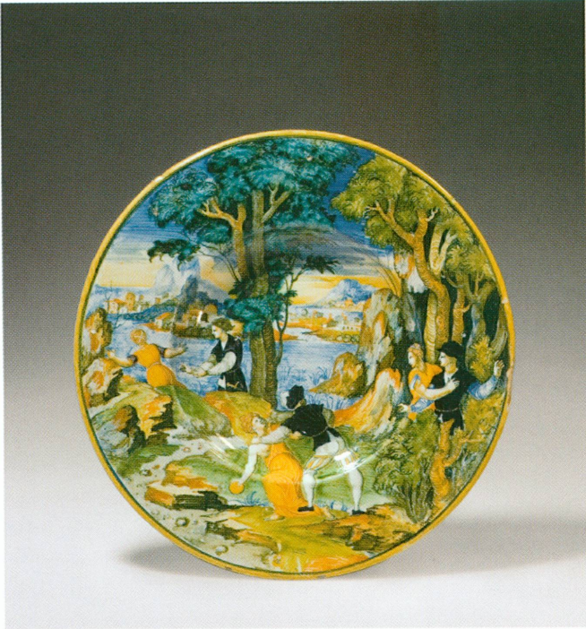
3 (à gauche). Urbino, atelier de Guido di Merlino | Tondo ( Atalante et Hippomène ), 1541 | Majolique, Ø 28,3 cm (MA, inv. AR 2007-126 [don Clare van Beusekom-Hamburger, Crans-près-Céligny])