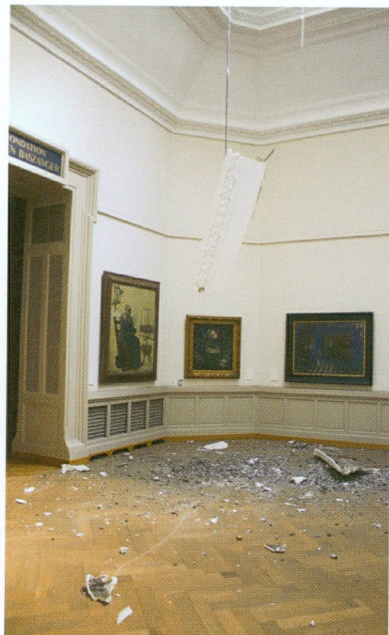
1 (à gauche). Incident du 31 août 2007 : effondrement d'une corniche dans la salle Baszanger, Musée d'art et d'histoire, Genève