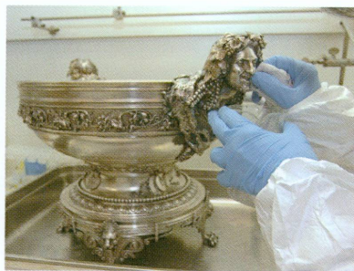
6. Atelier de conservation-restauration des métaux précieux : en vue de sa présentation dans la nouvelle salle d'argenterie du Musée d'art et d'histoire, traitement du bol à punch de l'«Alabama», création d'Edward C. Moore pour Tiffany & Co, New York, 1872 | Argent partiellement doré (MAH, inv. AA 17232)

été mis en œuvre. Son efficacité a été testée avec succès lors de l'exposition Philippe de Champagne . Dans le cadre de sa collaboration à la préparation des expositions temporaires, le secteur a été appelé à intervenir sur les objets archéologiques provenant de Gaza : les pièces les plus fragiles et instables ont été restaurées, les bronzes malades ont été traités, ainsi que plusieurs céramiques et verres fragiles. Les collections permanentes ont bénéficié de soins attentifs (fig. 6), divers lots d'objets antiques, byzantins, égyptiens, proche-orientaux et grecs ayant fait l'objet de traitements de restauration. Une campagne de contrôle de l'état des objets étrusques a été réalisée à l'occasion du démontage de la salle, avant travaux de rénovation.