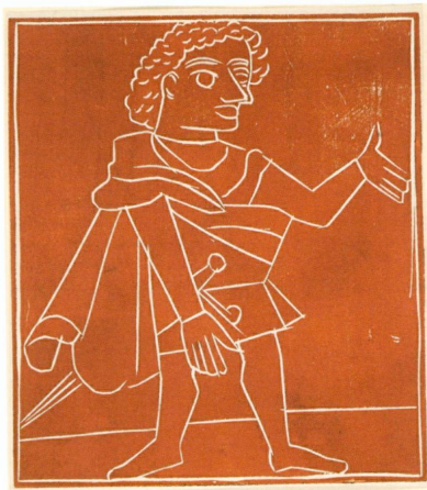
3 (à gauche). André Derain (Châto [Yvelines], 1880 – Garches [Seine-et-Oise], 1954) | Panurge , 1943 | Xylographie (en un passage) sur chine, 227 × 201 mm (CdE, inv. 2006-249 [don Olivier Weber-Caflisch]) | Tirage d'essai pour l'illustration de la page 52 du chapitre IX du Gargantua de Rabelais, Paris, chez Albert Skira, 1943