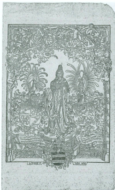
6. Erhard Reuwich (Utrecht, 1455 – Mayence, 1490), Bernard von Breydenbach (Mayence, vers 1440 – vers 1497), auteur du texte | Frontispice pour Santa Peregrinationes , [Mayence] 1486 | Xylographie sur vergé, 271 × 197 mm (CdE, inv. E 2006-12 [don du Cercle des Estampes])

de l'infatigable activité d'Albert Skira également, la collaboration qu'il entreprit dans ces mêmes années 1940 avec André Derain (1880-1954) en vue de l'illustration du Gargantua de Rabelais (fig. 3) est désormais mieux représentée dans notre ville grâce à l'épreuve qu'Olivier Weber-Caflisch a offerte au Cabinet des estampes. Il s'agit d'une feuille de maquette portant la figure de Panurge en rouge, avant l'application des teintes supplémentaires (E 2006/249).