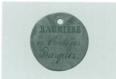
4 (à gauche). Auteur anonyme | Jeton « BARRIÈRE de l'Isle des Barques », vers 1820 | Laiton, Ø 27 mm (CdN, inv. CdN 1632)