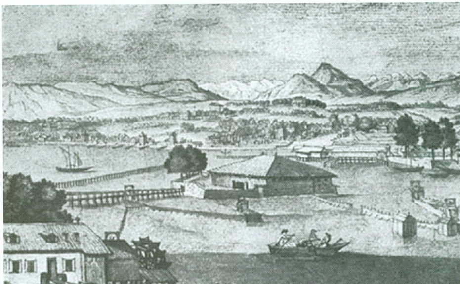
3. Wolfgang-Adam Töpfer (1766-1847), attribué à, ou auteur anonyme | Genève, l'île des barques , fin du XVIII e – début du XIX e siècle | Lavis sur papier, 29 × 28,5 cm (CIG [coll. Vieux-Genève], inv. VG 567)

au lac 7 ». Après discussion, le Conseil convint de l'«utilité de cest œuvre, tant pour forteresse que pour l'embellissement et l'accroissement de la ville». Malgré quelques plaintes des habitants des quartiers alentour, craignant des inondations par cette construction, les travaux débutèrent peu de temps après, en mars 1585. Dès avril 1587, la Seigneurie projeta d'entreposer sur la nouvelle île la barque des seigneurs de Berne, en construction à Genève. Progressivement, l'île devint un chantier naval, qui jusque-là se trouvait à Longemalle. Les bateaux furent dès lors entreposés sur l'île, amarrés ou tirés sur la berge, simplement protégés par des bâches et des planches. C'est ainsi que, au XVII e siècle, l'île prit le nom d'Île aux barques.