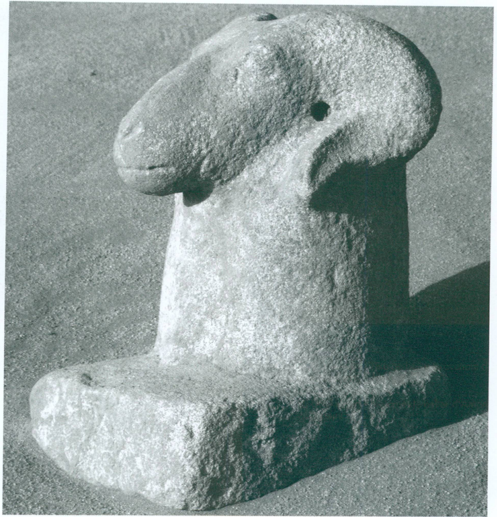
4. Doukki Gel | Protomé de bélier d'Amon, grès peint

6. On trouvera, par exemple, des représentations de Thoutmosis IV manipulant ces deux catégories d'objets sacrés dans BRYAN 1987, pp. 18-19.