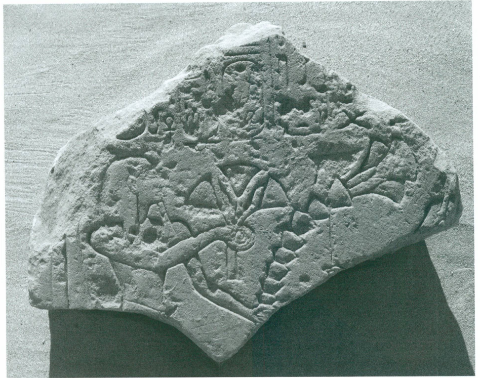
7. Doukki Gel | Stèle fragmentaire de Ramsès II montrant le pharaon offrant un bouquet à l'Amon de Pnoub

Une stèle fragmentaire de Ramsès II (fig. 7), mise au jour dans le fond de la fosse située au sud de la cachette, présente un grand intérêt dans la mesure où le roi, qui était absent jusqu'ici sur le site de Doukki Gel, est figuré faisant l'offrande d'un bouquet monté à l'Amon de Pnoub dont la silhouette a presque complètement disparu, mais dont le nom et l'épithète subsistent en majeure partie.