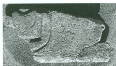
1. Doukki Gel | Fragment d'un bloc de grès avec inscription mentionnant le nom de naissance de Thoutmosis III