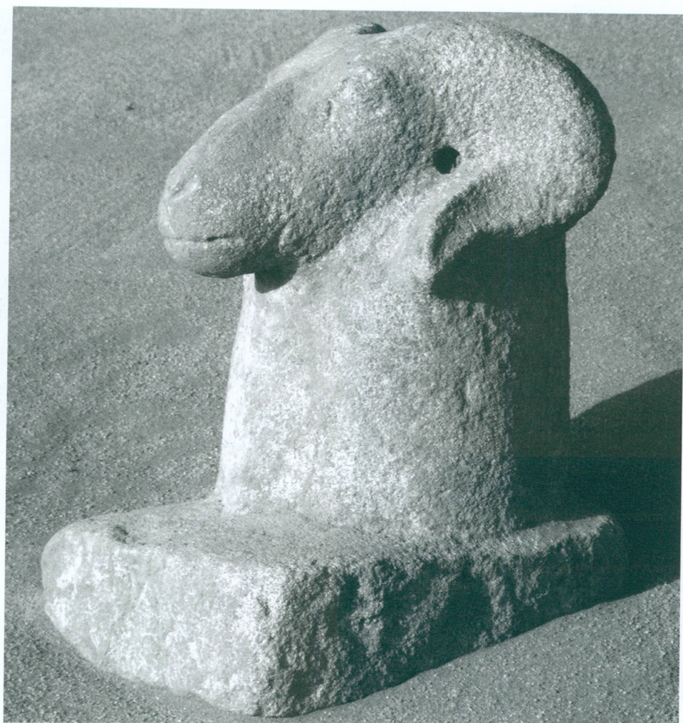
4. Doukki Gel | Protomé de bélier d'Amon, grès peint

6. On trouvera, par exemple, des représentations de Thoutmosis IV manipulant ces deux catégories d'objets sacrés dans BRYAN 1987, pp. 18-19.