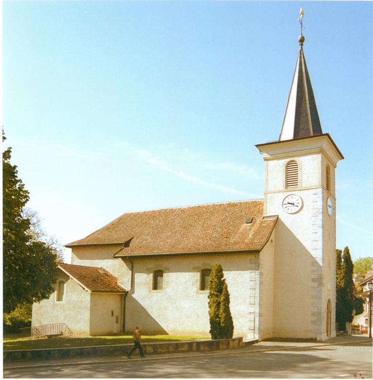
1. Vue extérieure de l'église actuelle (printemps 2004)