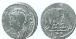
3. Empire romain, Rome, 330, follis | Fouilles de Saint-Gervais, M 552, MAH, inv. CdN 2003-62

Avers: VRBS – ROMA ; buste casqué à gauche, portant le manteau impérial Revers: louve romaine surmontée d'une étoile à huit rayons. À l'exergue: RFQ Bronze, 2,147 g, Ø 17,2/16,6 mm, axe des coins env. 180° BRUUN 1966, p. 336.331