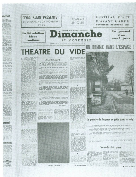
4. Yves Klein | Dimanche: la révolution bleue continue: le journal d'un seul jour , Paris 1960 (BAA, inv. 2003_per_p_3)