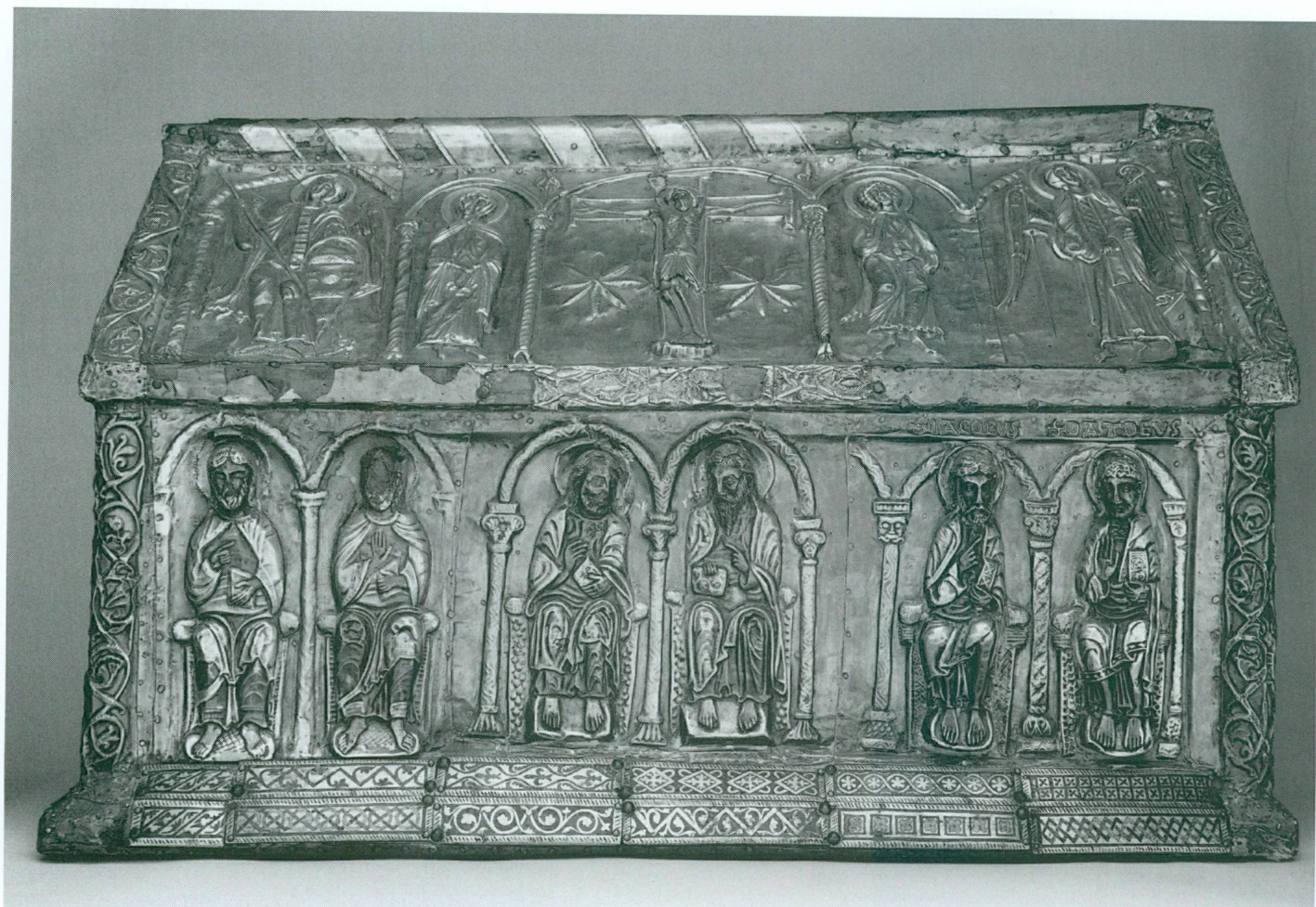
3. Châsse des Enfants de saint Sigismond · Face B, fin XII e – début XIII e siècle | Bois, argent partiellement doré, émaux sur cuivre doré, 70,5 × 33,5 × 43,2 cm (Trésor de l'abbaye de Saint-Maurice) | Vue avant restauration

(intervention directe d'interlocuteurs du Musée) et « médiation-support » (accompagnement indirect du visiteur par le biais de supports imprimés ou multimédias). Destiné aussi bien aux jeunes – en cadre scolaire ou non – qu'aux adultes, il s'est déployé de deux manières : offre d'un programme culturel trisannuel « clé en mains » et développement d'actions coéducatives menées en partenariat avec différents acteurs sociaux. En plus des désormais traditionnelles visites-conférence ou visites-découvertes, et des Moments des enfants , ateliers , cours et formations , spectacles et concerts , P'tits carnets , Graines de curieux , boîte à outils du site Internet , deux nouvelles formes d'intervention ont été définies : les Moments pour tous et les Coins-coussins .