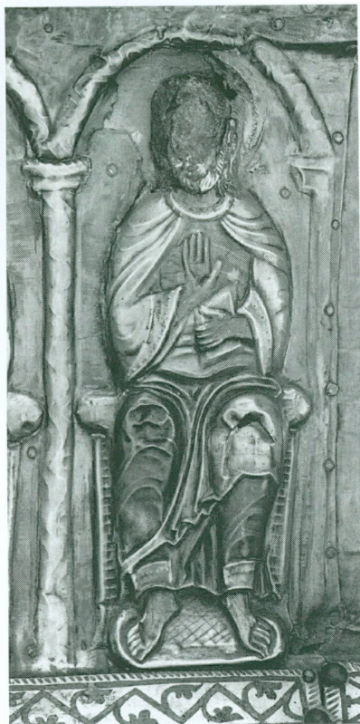
4. Châsse des Enfants de saint Sigismond · Face B, fin XII e – début XIII e siècle | Bois, argent partiellement doré, émaux sur cuivre doré, 70,5 × 33,5 × 43,2 cm (Trésor de l'abbaye de Saint-Maurice) | Détail de la plaque PB I (21 × 17,5 cm) : l'évangéliste saint Matthieu en place avec lacune au niveau de la tête (avant restauration)