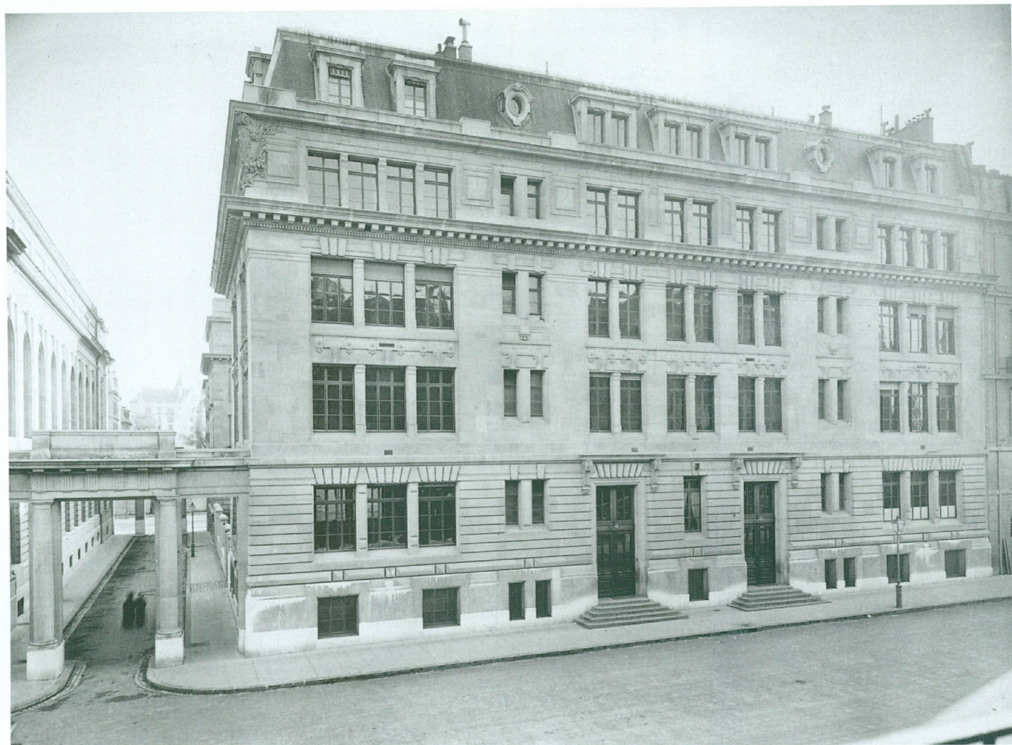
2. Photographie inconnu | L'école des Casemates , peu après son inauguration, vers 1905 | Tirage à l'albumine, monté sur carton, 17,2 × 22,5/24 × 30 cm (CIG, inv. VG P 597)