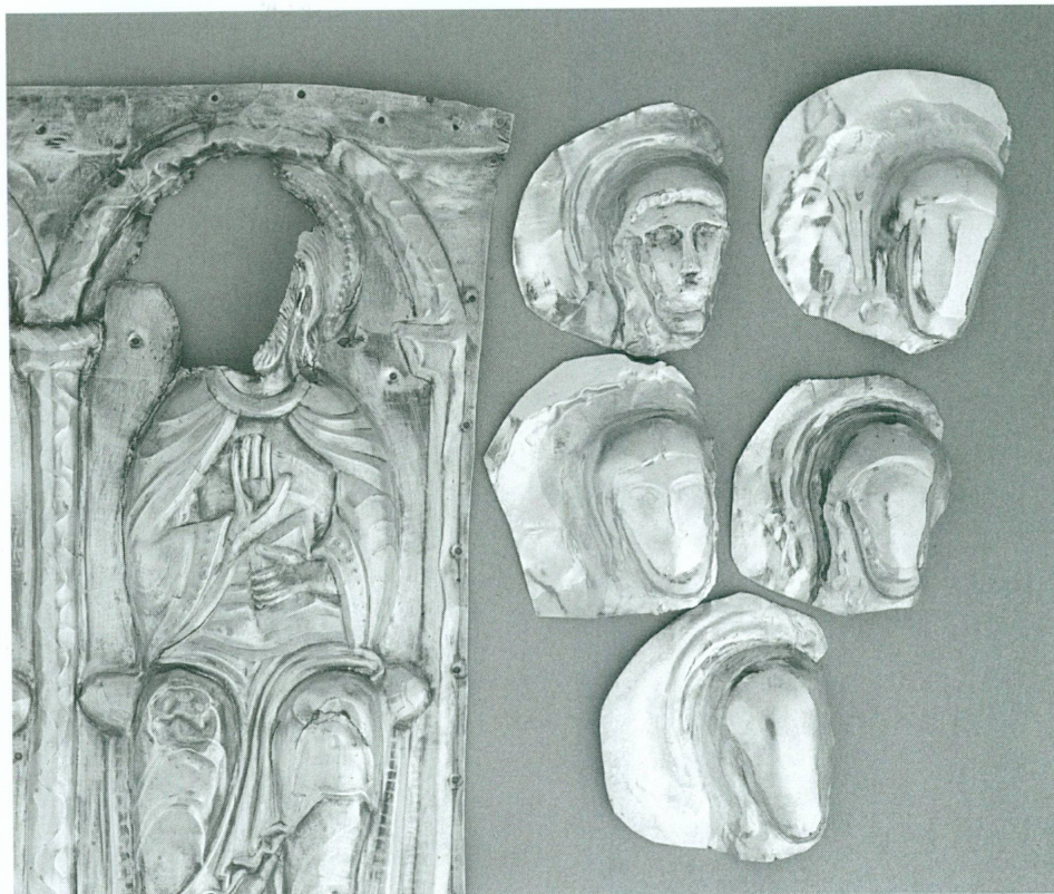
5. Châsse des Enfants de saint Sigismond · Face B, fin XII e – début XIII e siècle | Bois, argent partiellement doré, émaux sur cuivre doré, 70,5 × 33,5 × 43,2 cm (Trésor de l'abbaye de Saint-Maurice) | Détail de la plaque PB I (21 × 17,5 cm) : l'évangéliste saint Matthieu, après dépose et nettoyage, et propositions de comblement de la lacune à l'aide de différentes têtes modernes

Plus de quarante-six mille personnes ont pris part à près de mille cinq cents rencontres avec les publics abordant quatre-vingt-deux sujets différents 1 .