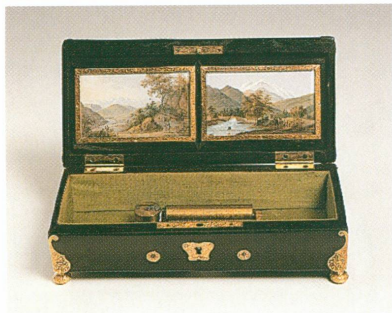
5. Coffret à bijoux avec musique mécanique 19,4 × 6,5 × 8,8 cm (MHE, inv. H 99-222)