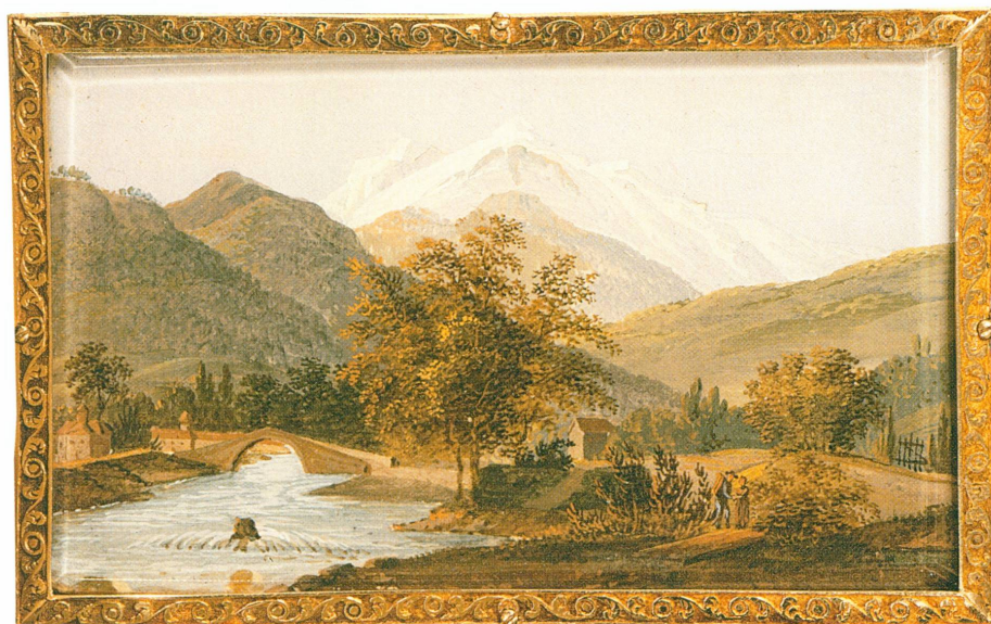
5. Coffret à bijoux avec musique mécanique 19,4 × 6,5 × 8,8 cm (MHE, inv. H 99-222)