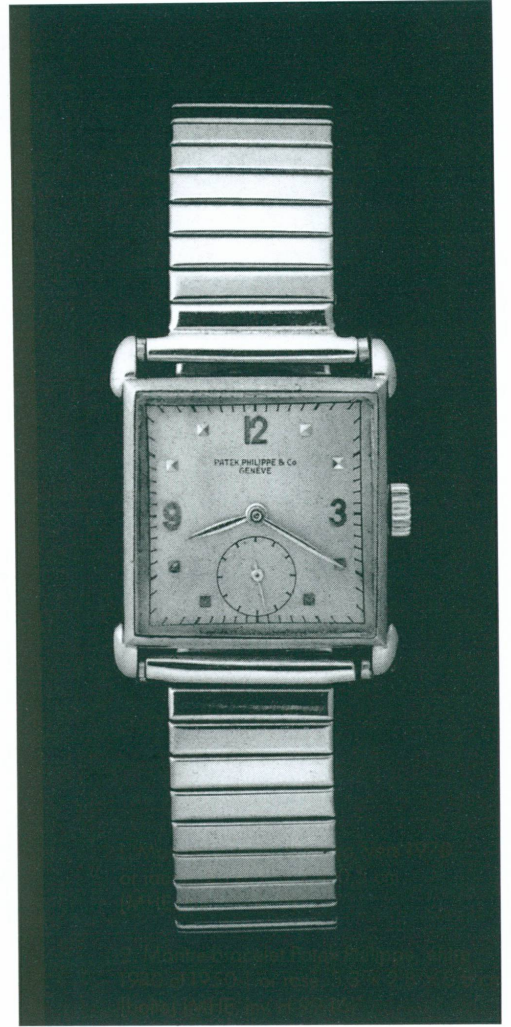
2. Montre-bracelet Patek Philippe, entre 1940 et 1950 | or rose, 3,3 × 2,8 × 0,8 cm [boîte] (MHE, inv. H 99-16)

Felipe Hecht (actif à Genève fin XIX e siècle)