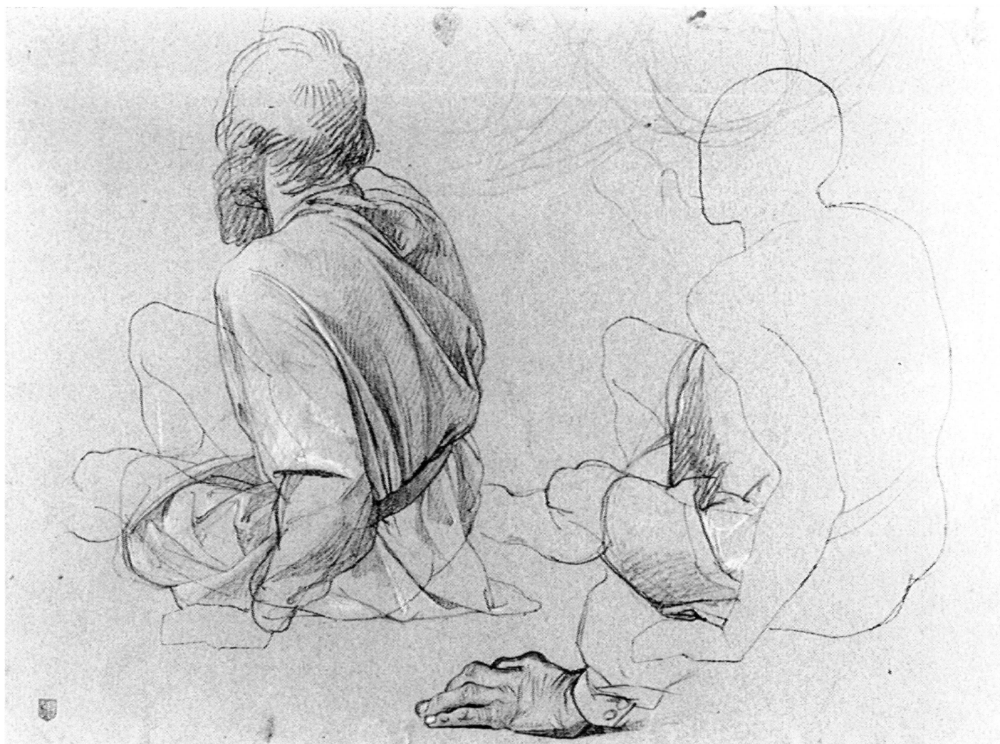
2. Jean-Léonard Lugardon, Etude pour la figure d'Henri de Melchtal , vers 1840. Plume et encre brune, mine de plomb, rehauts de craie blanche sur papier bleuté. 27,9 x 38 cm. Genève, Musée d'art et d'histoire, Cabinet des dessins, inv. 1912-24/59.

tion à partir du modèle d'académie : « greffées » sur le corps d'un jeune homme, une barbe rapidement crayonnée et une main ridée annoncent Henri de Melchtal (fig. 2). Mais les figures ne sont pas l'unique objet des soins de l'artiste : deux petites huiles et deux dessins témoignent d'une véritable recherche d'expression pour les bœufs 10 (fig. 3).