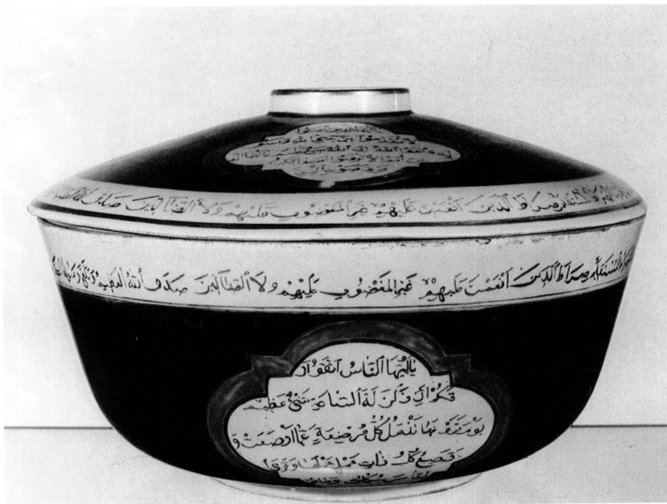
6. Terrine en porcelaine chinoise à décor ottoman. Bruxelles, Musées royaux d'Art et d'Histoire. Inv. E.O. 2545.