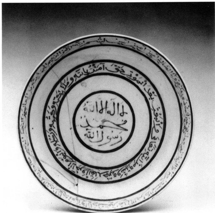
3. Avers du plat de porcelaine chinoise à décor ottoman. Diam. 29 cm. Istanbul, Topkapi Saray Museum, Inv. TKS 15/7377.