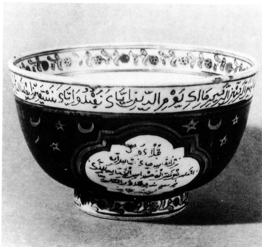
8. Tasse en porcelaine chinoise à décor ottoman. Haut. 7,8 cm. Diam. 5 cm. Anciennement collection Fr. Duchêne, Paris.

Concernant la calligraphie elle-même, il vaut la peine de rappeler que des inscriptions en caractères arabes étaient souvent exécutées en Chine, avec plus ou moins d'habileté il est vrai. On pense, par exemple, à la céramique dite de Swatow destinée au marché du Sud-Est asiatique et souvent décorée de textes coraniques. Or sur ce type d'objets, la lecture des inscriptions est souvent difficile, les textes étant parfois estropiés ou tronqués comme si les calligraphes chinois n'avaient pas vraiment compris ce qu'ils écrivaient 15 . Mais on connaît aussi des pièces d'exécution beaucoup plus soignée, faites probablement pour des musulmans résidant en Chine, peut-être même dans l'entourage de l'Empereur. Ainsi ce plat de l'époque Ming portant la marque de règne - le nien bao - de Zengde (1506-1521) transcrit phonétiquement en caractères arabes 16 .