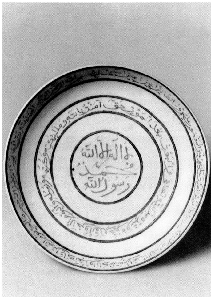
1. Avers du plat de porcelaine chinoise à décor ottoman. Haut. 3,8 cm. Diam. 22 cm. Inv. AR 8699.

avec ce commentaire : « où sont placées exclusivement des porcelaines provenant de l'Extrême-Orient, ainsi que quelques spécimens persans et arabes ». L'auteur du catalogue paraît avoir considéré le plat qui nous intéresse