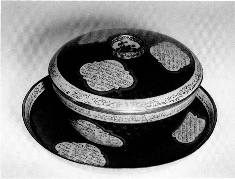
5. Terrine en porcelaine chinoise à décor ottoman, avec son présentoir. Haut. 18,9 cm. Diam. 30,05 cm ; présentoir diam. 45 cm. Paris, Musée Guimet, Inv. G 2688.