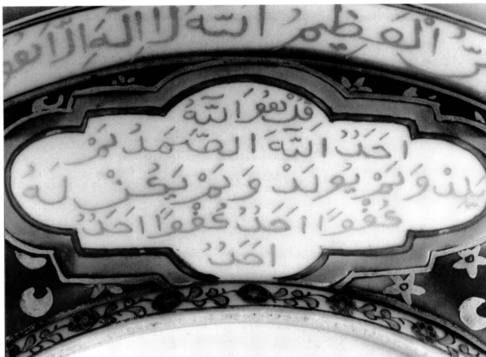
7. Détail du plat AR 8699. Réserve contenant la sourate 112; centré au-dessus, le début du texte de la sourate 2, verset 255/56.

intérêt de « collectionneurs » ou de « connaisseurs » de la part des Sultans ou de leurs intendants, mais pour répondre à des préoccupations essentiellement utilitaires. Le Trésor ne s'est constitué, du reste, que très exceptionnellement par des acquisitions proprement dites, la plus grande part des pièces provenant de cadeaux, de dots, de butins et, surtout, d'une sorte d'impôt de succession, le muballefat , loi qui exigeait, à la mort des grands fonctionnaires ou autres personnages importants de l'Empire, la remise de leurs biens au Trésor. Souvent même, il pouvait s'agir purement et simplement de confiscation de ces biens 9 . A part ces données générales, les archives du Topkapi ne permettent pas de déterminer exactement comment les services qui nous intéressent sont entrés dans les collections du palais 10 .