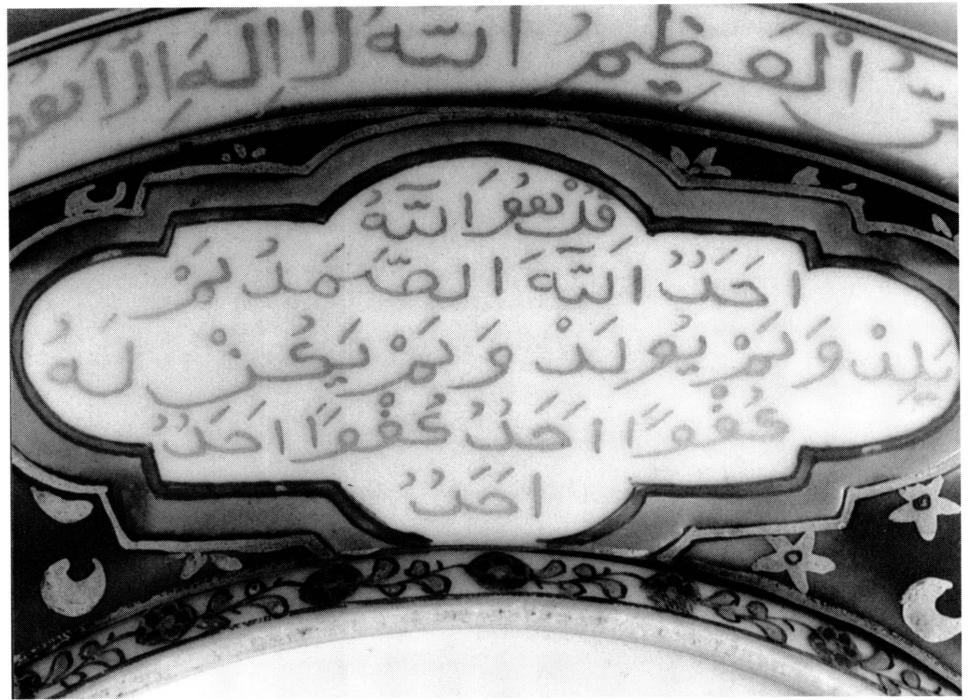
7. Détail du plat AR 8699. Réserve contenant la sourate 112; centré au-dessus, le début du texte de la sourate 2, verset 255/56.

intérêt de « collectionneurs » ou de « connaisseurs » de la part des Sultans ou de leurs intendants, mais pour répondre à des préoccupations essentiellement utilitaires. Le Trésor ne s'est constitué, du reste, que très exceptionnellement par des acquisitions proprement dites, la plus grande part des pièces provenant de cadeaux, de dots, de butins et, surtout, d'une sorte d'impôt de succession, le muballefat , loi qui exigeait, à la mort des grands fonctionnaires ou autres personnages importants de l'Empire, la remise de leurs biens au Trésor. Souvent même, il pouvait s'agir purement et simplement de confiscation de ces biens 9 . A part ces données générales, les archives du Topkapi ne permettent pas de déterminer exactement comment les services qui nous intéressent sont entrés dans les collections du palais 10 .