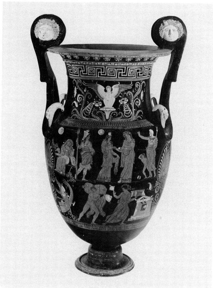
2. Amphore de Paestum. Vers 350 avant J.-C. Haut. 21 cm.