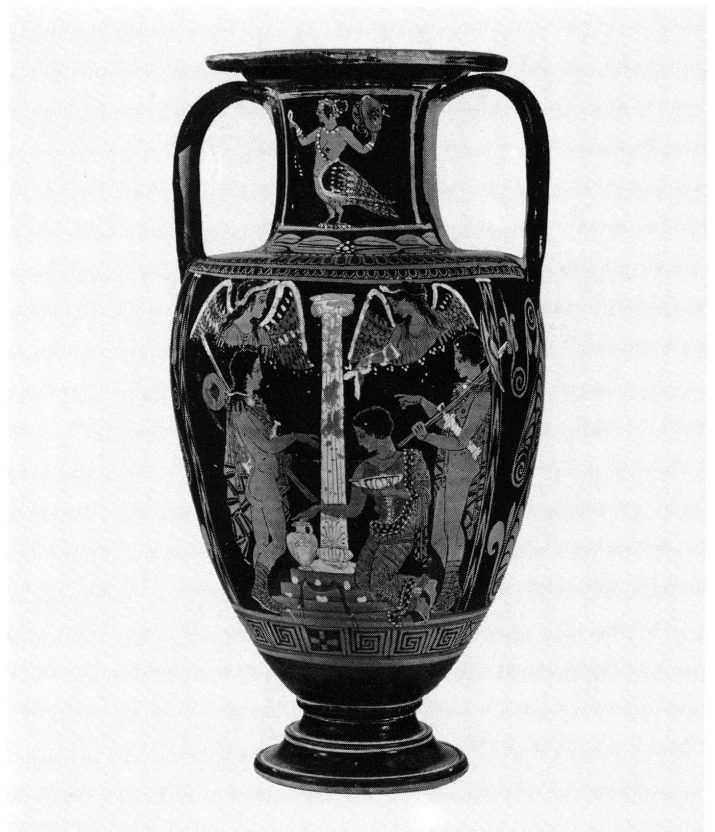
1. Cratère apulien. Vers 350 avant J.-C. haut. 74 cm.

Le musée de Genève possède une belle collection de portraits antiques. C'est dans le dessein de la compléter et de la diversifier que l'association a acquis un portrait de magistrat romain du I er siècle de notre ère, provenant de Syrie (à l'époque où Ponce Pilate était procurateur de Judée, sous le contrôle du légat en Syrie). Il s'agit d'une tête de calcaire un peu fruste, mais expressive.