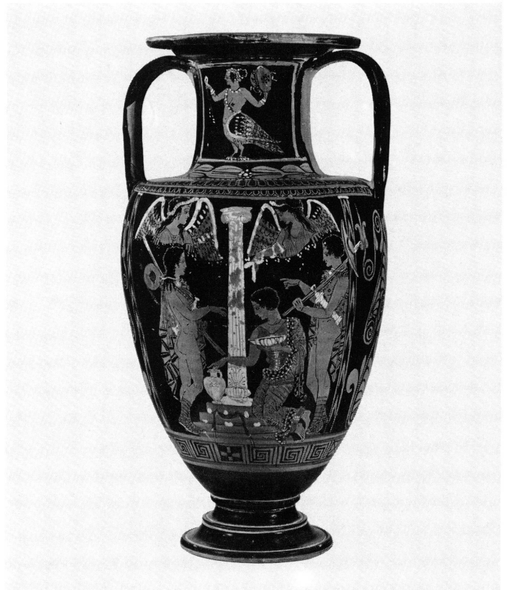
1. Cratère apulien. Vers 350 avant J.-C. haut. 74 cm.

Le musée de Genève possède une belle collection de portraits antiques. C'est dans le dessein de la compléter et de la diversifier que l'association a acquis un portrait de magistrat romain du I er siècle de notre ère, provenant de Syrie (à l'époque où Ponce Pilate était procurateur de Judée, sous le contrôle du légat en Syrie). Il s'agit d'une tête de calcaire un peu fruste, mais expressive.