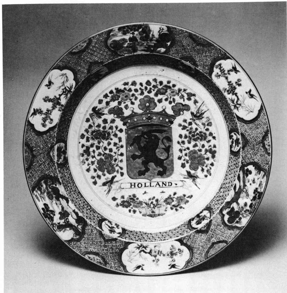
6. Musée Ariana, Genève, Inv. AR 3639.

demi-médallions décoratifs — six grandes réserves représentant d'une part trois personnages assis dans un paysage et d'autre part trois compositions de bambou et prunier, survolés par deux oiseaux.