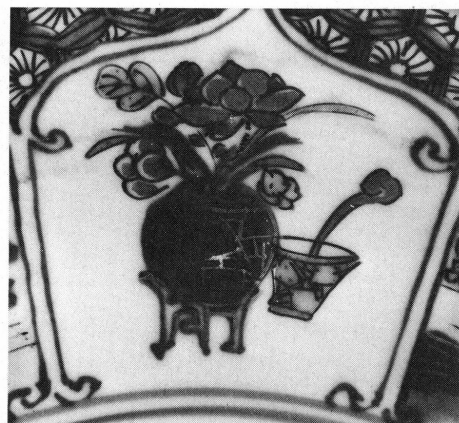
10 à 12. Musée Ariana, Genève, Inv. AR 3641, détails.