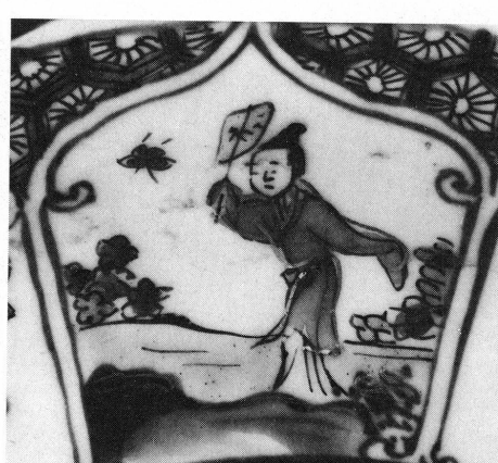
16 à 18. Musée Ariana, Genève, Inv. AR 3641, détails.