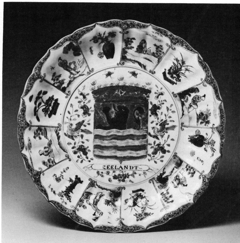
5. Musée Ariana, Genève, Inv. AR 3640.

individuelles. Rien de précis ne peut être opposé à cette explication qui a l'avantage de la simplicité. Il demeure étonnant que ces nombreux plats n'aient été utilisés par les commanditaires hollandais que pour des armoiries de collectivités et jamais pour des armoiries individuelles. N'est-il pas curieux aussi que la France et l'Angleterre soient les seuls pays étrangers mentionnés?