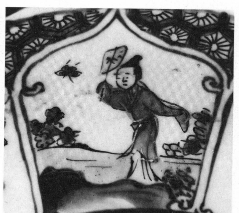
16 à 18. Musée Ariana, Genève, Inv. AR 3641, détails.