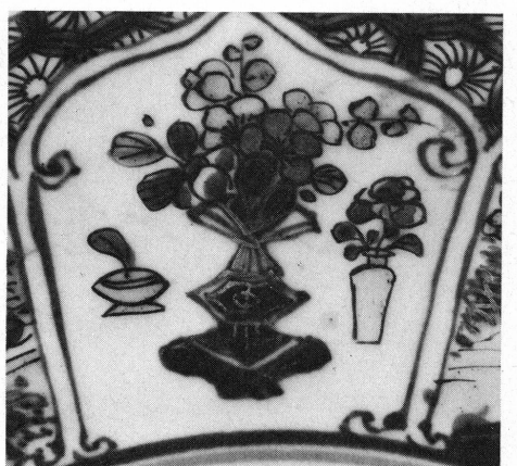
13 à 15. Musée Ariana, Genève, Inv. AR 3641, détails.