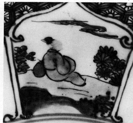
19 à 21. Musée Ariana, Genève, Inv. AR 3641, détails.

xviii e siècle, n'être plus que des motifs traditionnels de valeur décorative.