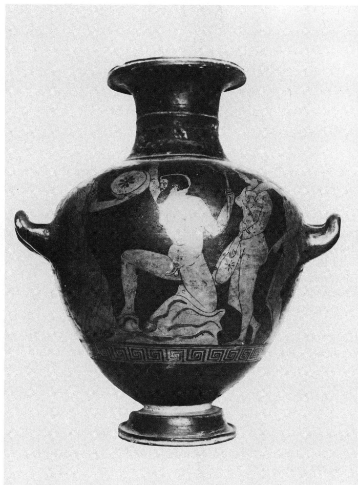
2. Hydrie du Musée d'art et d'histoire (inv. I 200). Pastiche du XIX e siècle.

Mais, revenons à la coupe de Genève. On remarquera que le guerrier porte la sorte de muselière qu'on appelait « phorbeia », instrument utilisé plus normalement par les joueurs de flûte ou aulos dans les banquets, les concours musicaux ou aussi à la guerre 9 . La bande de cuir était percée d'un trou pour le passage de l'embouchure de l'instrument. A quoi servait ce curieux accessoire, inconnu des musiciens modernes? Il devait empêcher que la lèvre de l'instrumentiste se fende sous l'effort, régulariser le souffle, masquer le gonflement des joues jugé disgracieux. Dans le cas des trompettes guerrières, ce dernier emploi n'entraînait certainement pas en ligne de compte 10 . Le décorateur de notre coupe, décidément peu attentif, a noué la lanière au-delà du couvre-nuque du casque et non contre lui, ce qui, bien entendu, ne correspondait pas à la réalité.