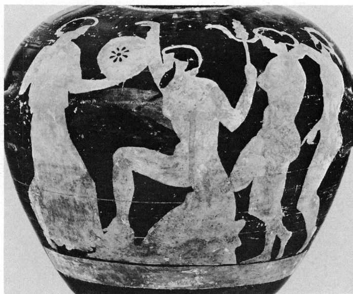
3. La même hydrie après décapage.

Le deuxième vase qui a retenu mon attention est une hydrie ou vase à trois anses (Inv. I 200) mesurant 39,5 cm (fig. 2). On le reconnaît dans un tableau de S. Straub représentant le collectionneur Walter Fol (1832-1890). L'objet est posé, bien en évidence, sur une table recouverte d'un lourd tapis et jonchée de gros in-folio. Fol ne contemple pas le vase, mais consulte un livre d'enluminures. La scène se passe à Chougny-Fontaine, dans le salon d'une grande maison du XVIII e siècle, aujourd'hui propriété d'un autre amateur éclairé 11 .