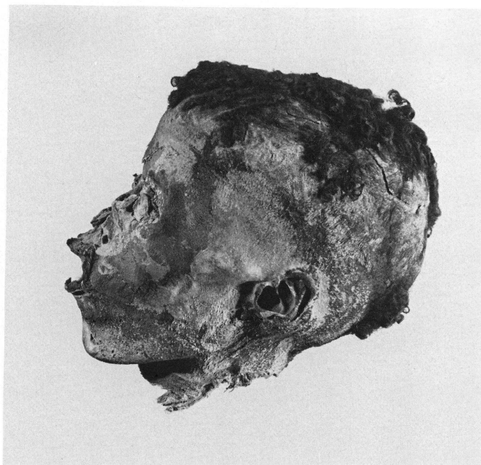
1. Tête de l'archer. Tombe 57.