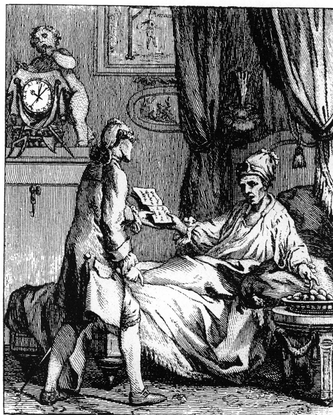
1. Frontispice des Œufs rouges (1772).