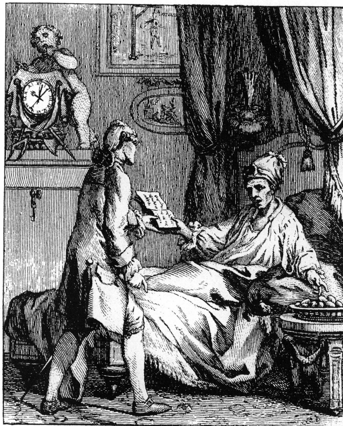
1. Frontispice des Œufs rouges (1772).