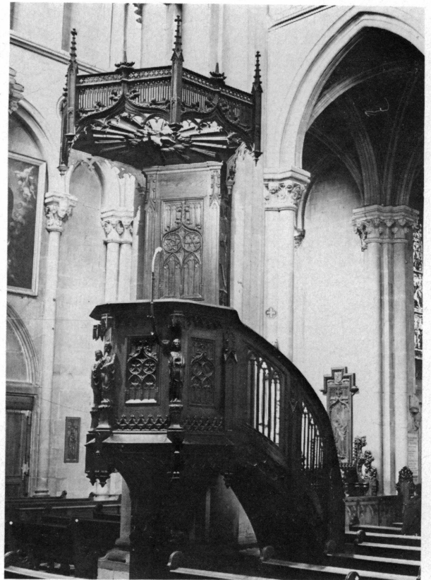
Fig. 5. La chaise fut sculptée, ainsi que le grand Christ en croix et les stalles, par un artiste local, M. Jeunet. Son abat-son s'inspire de celui de la cathédrale Saint-Pierre.

Le clocher de Notre-Dame n'est pas terminé. Une brochure de 1909 demande si une âme généreuse ne ferait pas à l'édifice l'hommage d'une flèche 5 . Nous espérons que cette âme généreuse donnera un autre cours à ses largesses, car il est impossible de compléter avec bonheur une œuvre sans connaître les intentions réelles de son auteur.