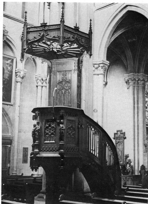
Fig. 5. La chaise fut sculptée, ainsi que le grand Christ en croix et les stalles, par un artiste local, M. Jeunet. Son abat-son s'inspire de celui de la cathédrale Saint-Pierre.

Comme le remarquait un éminent spécialiste suisse, ils constituent la plus remarquable série de cette époque en Suisse et peut-être en Europe.