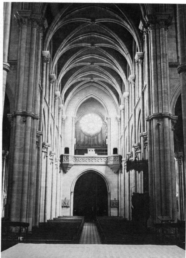
Fig. 4. Vue de la nef en direction de l'entrée principale.