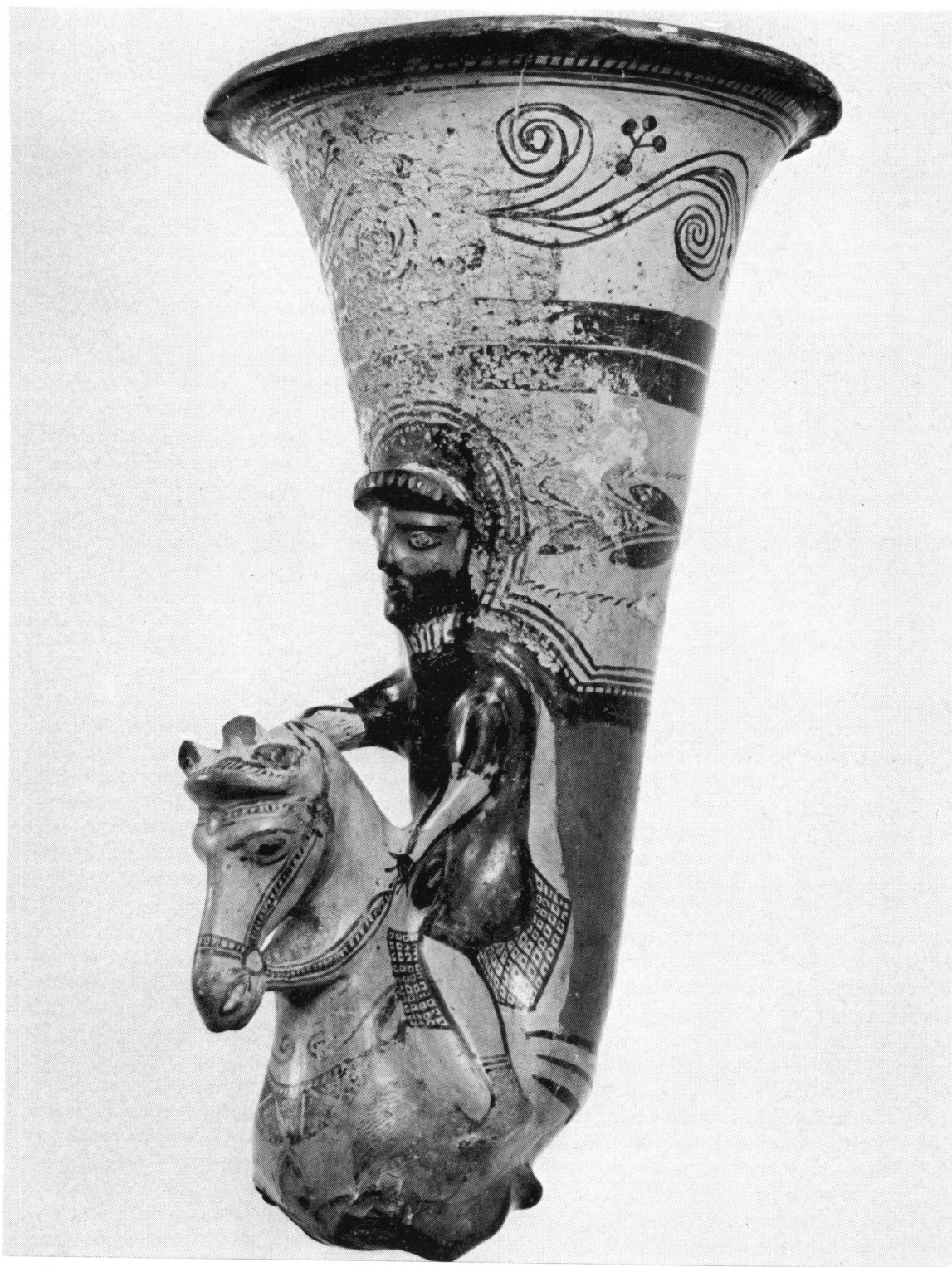
Fig. 2. Rhyton du Musée de Genève.