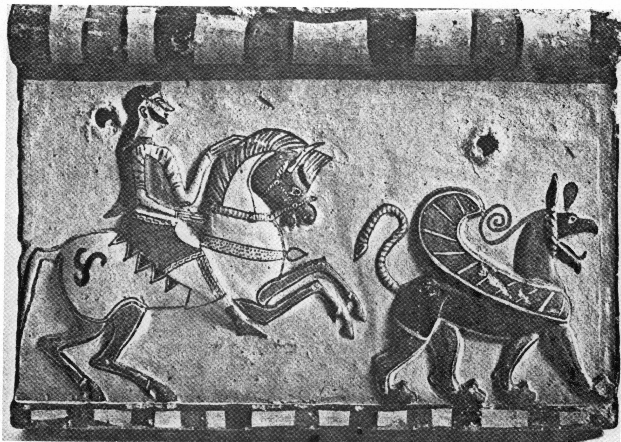
Fig. 4. Plaque de revêtement en terre cuite. Musée d'Israël, Jérusalem.

tres types de représentations figurées qu'il faut se référer pour en trouver des parallèles. Et l'on est immédiatement amené à rapprocher ce cavalier et sa monture de ceux qui ornent les plaques de revêtement architectoniques en terre cuite polychrome du vi e siècle av. J.-C., découvertes à Düver près de Burdur, c'est-à-dire aux confins de la Lydie et de la Phrygie antique 15 . On y voit représentée en relief toujours la même scène : un cavalier caracolant vers la droite précédé d'un griffon ailé.