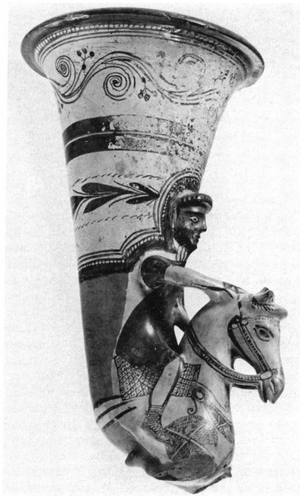
Fig. 1. Rhyton du Musée de Genève.

pupille noire, barre de sourcils noirs, interrompue à la racine du nez, barbe embroussaillée, rendue par des hachures noires, sur le front, coiffure en bourrelet dentelé en relief, du ton de l'argile lustrée; justaucorps blanc à haut col côtlé marqué par des stries rouges, à manches longues et pantalon serré dans des bottines lacées, faites d'une semelle de cuir, rendue en argile lustrée, maintenue par des lacets rouges entrecroisés, à la façon d'espadrilles; tunique rouge, bordée en bas d'un large galon noir, à manches courtes noires, ornées d'un pompon noir se détachant sur la surface blanche de la manche du justaucorps; les mains peintes en noir, la gauche