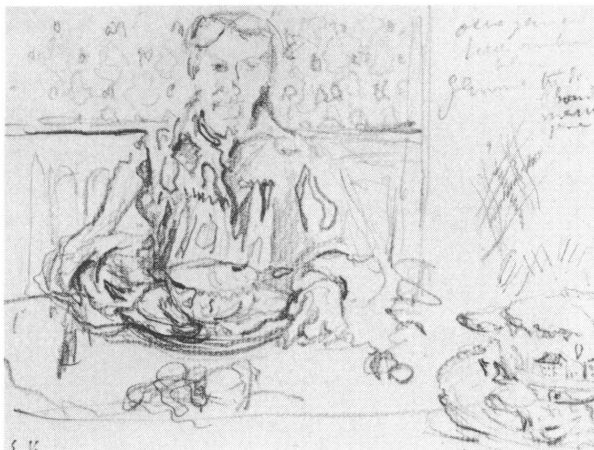
Fig. 10. Edouard VUILLARD. Le repas. Vers 1890. Inv. 1975-70

Sculpture monumentale en bronze. Inv. 1974-15. Déposée sur l'ancienne promenade de l'Obser- vatoire.