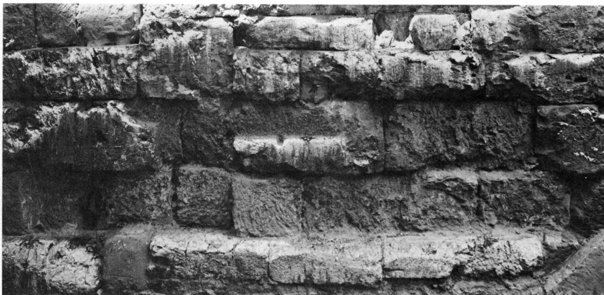
Fig. 3. Le rempart romain, 7, place de la Taconnerie.

7, place de la Taconnerie . Le tracé de l'enceinte correspond ici à celui du mur séparant au sud-est l'immeuble 11 de la rue de l'Hôtel-de-Ville et au nord-ouest l'ensemble qui porte les nos 9 de la même rue et 7 de la place de la Taconnerie. Louis Blondel a reconnu ce tracé dès 1923. Dans la cave du n° 9, dont le niveau est de peu inférieur à celui de la rue, fortement en pente à cet endroit, était encastré un bloc de pierre sculptée. Désireux de l'obtenir, le Musée reçut l'autorisation d'entreprendre des travaux en 1928. Ceux-ci ont été menés dans deux directions: le bloc fut extrait 64 avec vingt autres fragments sculptés présentant un intérêt 65 et, un peu plus loin, le mur d'enceinte fut dégagé sur une douzaine de mètres de longueur, dans le prolongement de la partie extérieure de la tour retrouvée à cette occasion et dont nous venons de parler ci-dessus. Le sol ayant été jadis fortement abaissé ici, cette partie de la muraille antique est soutenue par un soubassement du XVIII e siècle. L'épaisseur de ce rempart est de 2 m 75; mais, comme les blocs ont tous été ravalés à l'extérieur, Blondel pense que la fondation intacte avait au moins 3 m d'épaisseur. La hauteur actuelle de la muraille dépasse 7 m 66 .