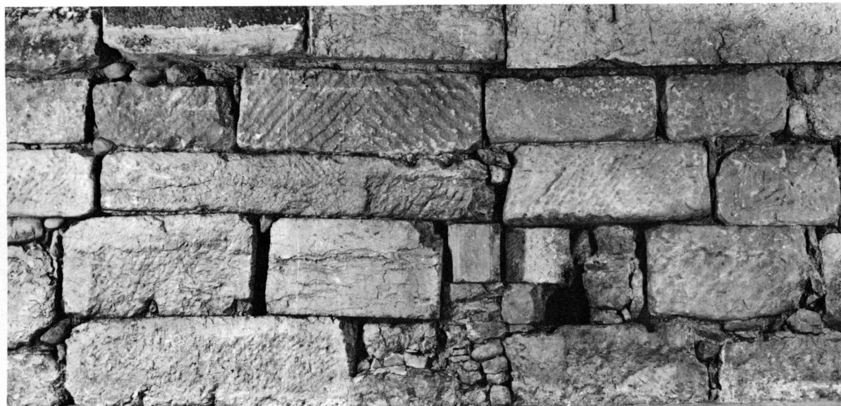
Fig. 4. Le rempart romain, 1, place de la Taconnerie.

a, probablement au moyen âge, beaucoup diminué l'épaisseur de ce mur. Des travaux de terrassement, pratiqués en 1969 en vue de la construction d'un garage privé derrière cet immeuble, ont permis de dégager la face extérieure de l'enceinte antique sur une longueur de 9 m 50 et une hauteur de 2 m 50 à 3 m. On n'a pas trouvé ici de pierres sculptées, mais les blocs portent de nombreuses traces d'une première utilisation. Une nouvelle étude attentive de la cave a révélé la tranchée de destruction laissée par les ouvriers médiévaux, ce qui autorise à fixer la largeur de la muraille à cet endroit entre 2 m 75 et 3 m. La présence de plusieurs ciments oblige à dire que le mur a été élevé en plusieurs étapes 71 . D'autre part, on a découvert, environ 3 m 60 devant le rempart, un autre mur haut de près de 2 m : le terrain étant là en forte déclivité, ce deuxième mur a son sommet conservé au même niveau que le bas de l'enceinte. Son état fragmentaire – on n'a dégagé ce mur que sur une longueur de 2 m 40 – ne permet pas de déterminer son rôle 72 : il faudrait pour cela procéder à des fouilles dans le jardin des immeubles 3 et 5. Quant au segment de l'enceinte proprement dite, qui n'est éloigné du