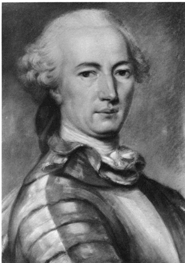
Figure 13. Le colonel Pierre Pictet de Serigny, pastel attribué à J.B. Perronneau (n° 277).

Paru dans: Le Sapajou , no 28, Genève, 18 juin 1896, p. 221.