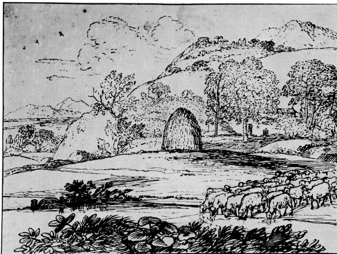
Fig. 2. Claude GELLÉE: Paysage . Collection Wildenstein.

catalogue de la vente: lot 1388, « a castle, with a running stream in the foreground; trees in the middle distance, and trees on a rising ground; signed, Claudio, 1660, Roma. Pen, washed, 10 in. by 7¼ in. » Il passa pour la somme modeste d'une livre à un marchand, puis apparut à nouveau dans la collection de Barthélemy Menn et de son beau-fils Bodmer, qui le légua, comme œuvre anonyme, au musée en 1912. Comment expliquer que le dessin finit par perdre son ancienne attribution correcte? Il est vrai que la signature « Claudio », mentionnée dans le catalogue de la vente, n'est guère lisible à présent, et le prix atteint à la vente marqua le dessin comme une œuvre peu importante, sinon d'un imitateur. Si certains dessins fameux rapportèrent alors de vingt à cent livres, il est pourtant vrai que la majorité des Claude de Wellesley n'atteignirent que quelques livres. Mais la raison profonde de l'oubli de ce dessin tient à une question de goût: l'ère de l'Impressionnisme découvrit en Claude non plus les paysages classiques composés dans l'atelier, mais un autre aspect de son œuvre tout aussi légitime. Nous entendons par cela le dessin de nature pris sur le vif, d'une inspiration très immédiate, exécuté au moyen de quelques coups brillants