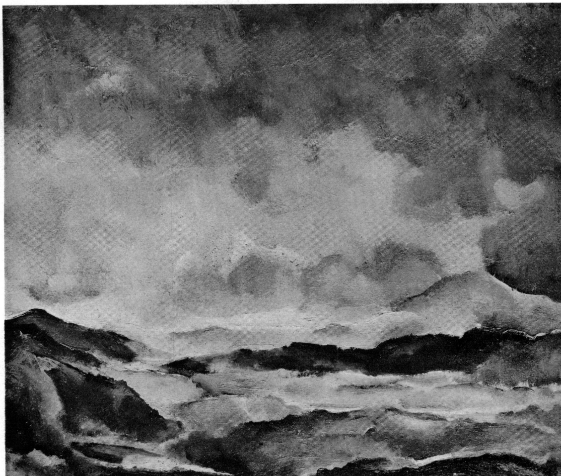
Fig. 1. Rodolphe-Théophile Bosshard, Paysage au ciel mauve , (legs M me René Hentsch).