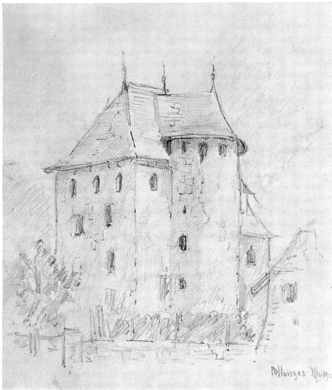
Fig. 4. Château de Polling. Dessin de Louis Blondel.