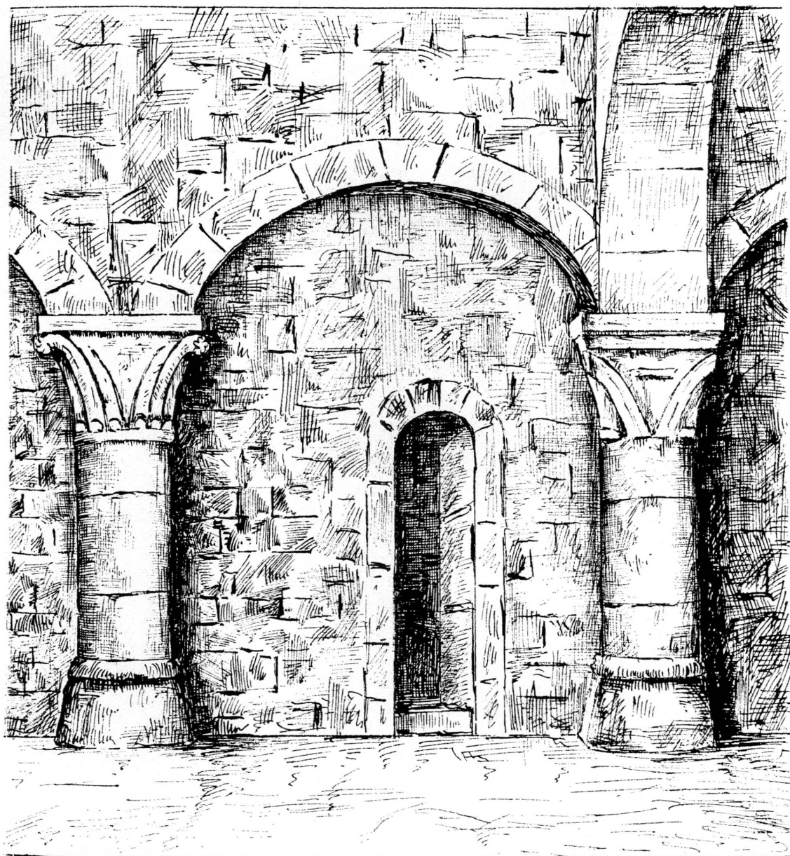
Fig. 2. Cave romane. Maison Tavel. Dessin de Louis Blondel (1901).