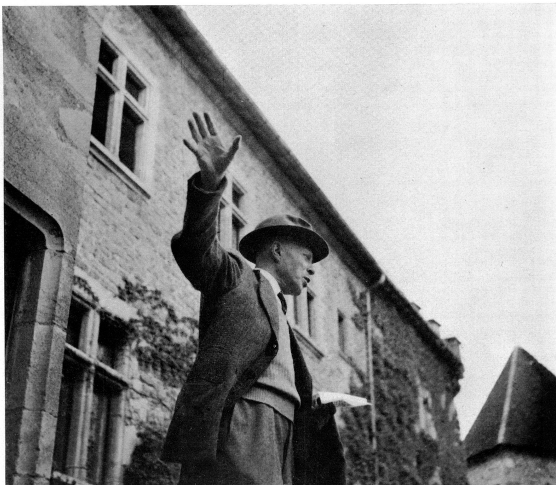
Fig. 1. Excursion de la Société d'histoire et d'archéologie de Genève en Franche-Comté en 1950. Château du Pin, près Lons-le-Saunier

des antiquaires de France, la Société française d'archéologie l'associèrent à leurs travaux en qualité de membre correspondant. Son audience à l'étranger était grande ; en 1921, il collabora au Congrès international d'histoire de l'art et, en 1951, au 3 e Congrès international du haut moyen âge ; en 1952, il fut l'un des participants les plus actifs de la 110 e session du Congrès archéologique de France tenue en Suisse romande.