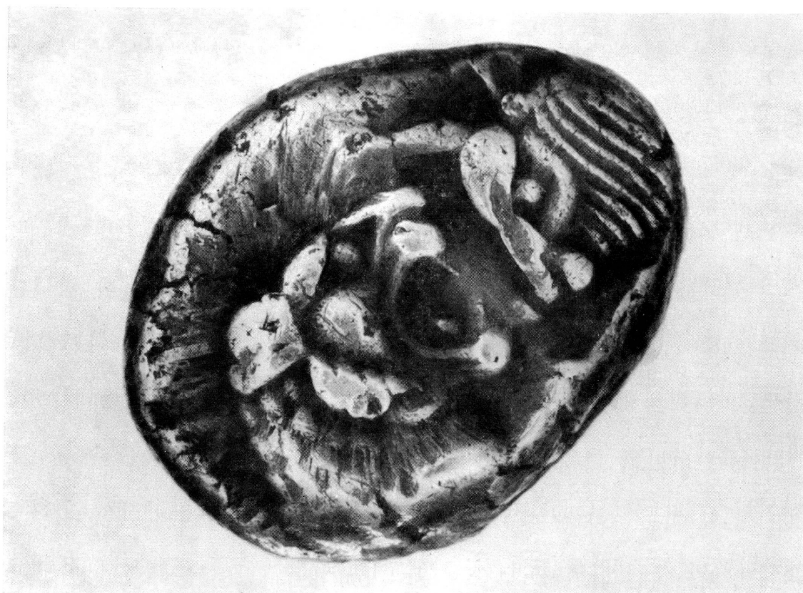
Fig. 2. Lydie Crésus , demi-statère d'argent.

drachme. — Géla: 466-415 avant J.-C., tétradrachme. — Géla: avant 466 avant J.-C., didrachme. — Messine: 480-461 avant J.-C., tétradrachme. — Syracuse: 485-478 avant J.-C., tétradrachme. — Posidonia: 470-400 avant J.-C., statère. — Lydie: Crésus demi-statère d'argent. — Milet: electrum hemi-hècte avec 14 contre-marques. — Lydie: Allyates, electrum demi-statère. — Thrace: Aenos, 440-412 avant J.-C., tétradrachme. — Agrigente: 550-413 avant J.-C., didrachme. — Crète: Phaestos, 400-360 avant J.-C., Rv. taureau dans une couronne de laurier. — Crotone: vers 420 avant J.-C., didrachme. — Dyrrachium (Illyrie): 450-350 avant J.-C., didrachme. — Phocide, guerre sacrée, monnayage fédéral, 357-346 avant J.-C. — Paphlagonie: Sinope, IV e siècle, drachme. — Vélia (Hyélé): 400-268 avant J.-C., didrachme. — Chypre: Zotimos, vers 385 avant J.-C., ville d'Amathonte. — Cilicie: Célendéris, 400-350 avant J.-C., statère. — Philippe II de Macédoine, 359-336 avant J.-C., tétradrachme. — Les Bruttii: 282-200 avant J.-C., drachme. — Vélia: deuxième guerre punique, drachme. — Péonie: Andoléon, 315-286 avant J.-C., triobol. — Rois de Syrie: Séleucus III, 226-222 avant J.-C., tétradrachme; Antiochus IV, 175-164 avant