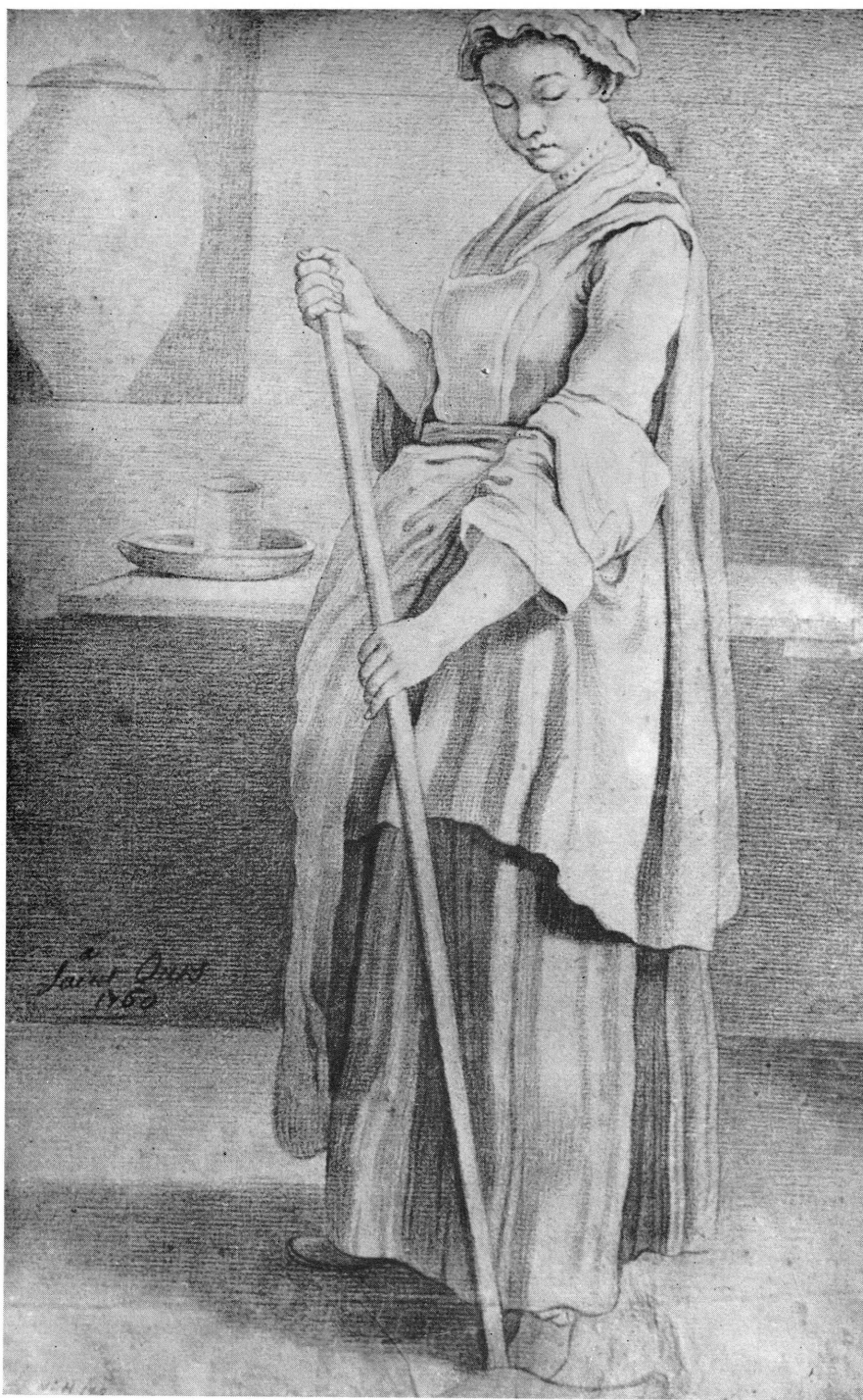
Fig. 3 — Jacques Saint-Ours : La ménagère . Dessin