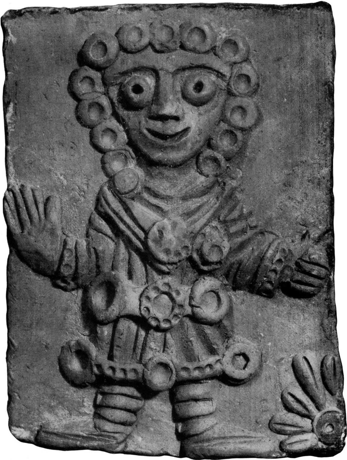
Fig. 4 — André Derain : Femme aux médailles . Terre cuite