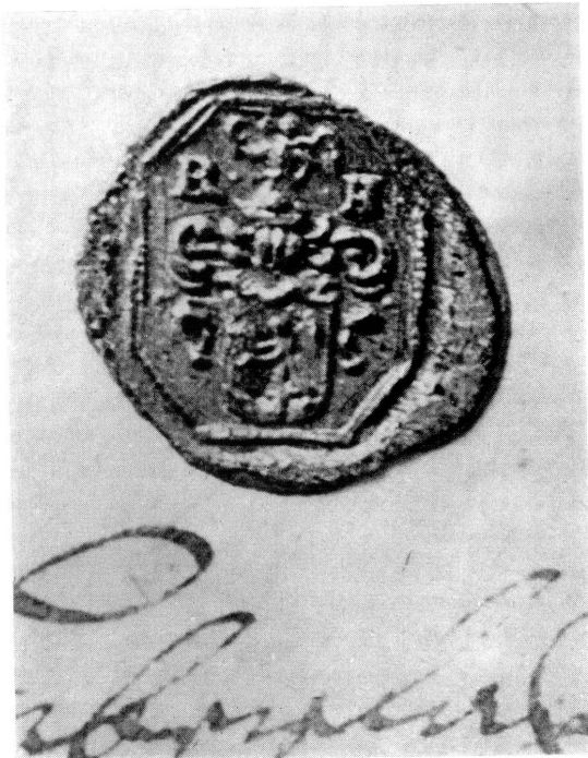
Fig. 1. — Armoiries et signature de Gottfried Haberlandt