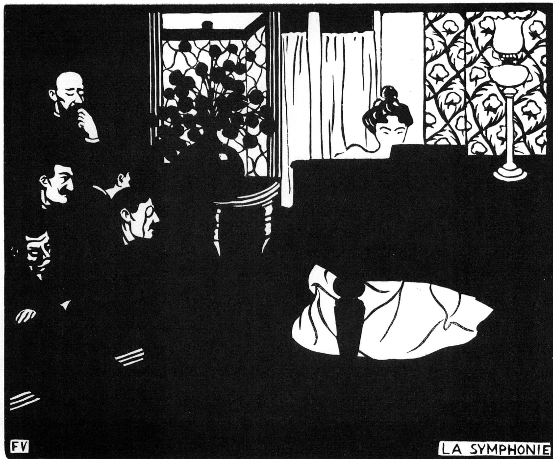
Fig. 4. — F. Vallotton: La symphonie , Bois.