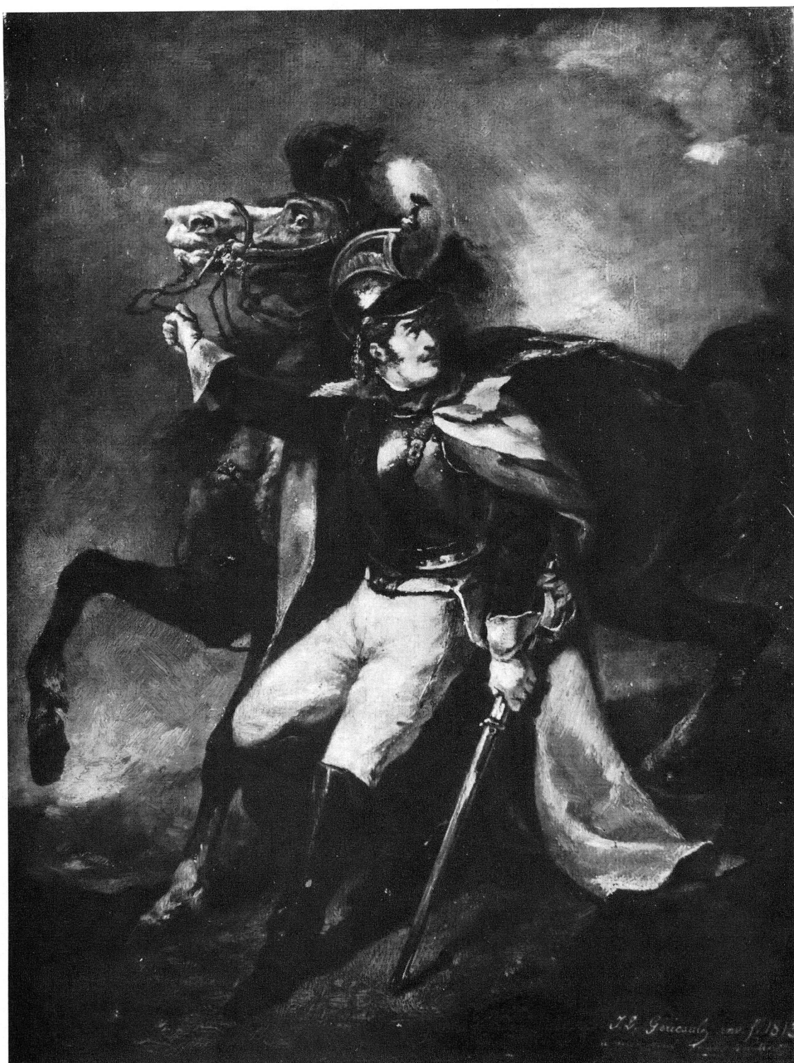
Fig. 2. — Théodore Géricault: Le cuirassier blessé (étude). Huile.