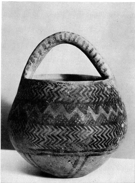
Fig. 1. — Vase à décor noir sur fond rouge. Perse. (19706)

19703. — Vase en terre cuite grise à pied et anse latérale. Tepe Djamshidi? Hauteur: 240 mm.