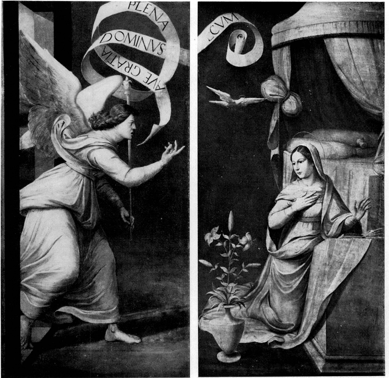
Fig. 62. — GUIGONIS: L'Annonciation.