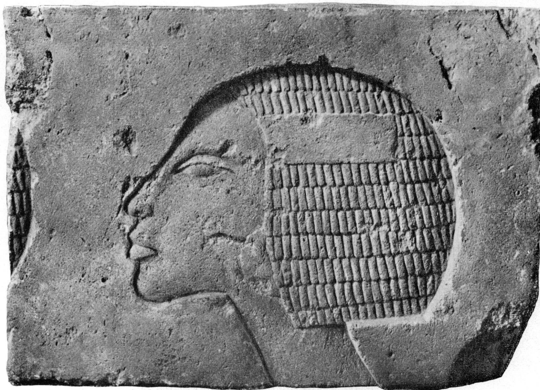
Fig. 61. — Bas-relief amarnien.

19581. — Saint Gilles . Statue en bois polychrome. Sud-Est, XVI e siècle. Hauteur: 132 cm.