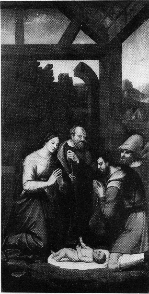
Fig. 63. — GUIGNONIS: L'Adoration des bergers.