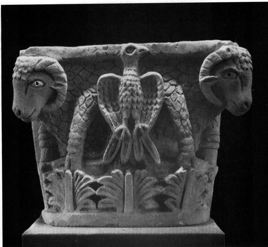
Fig. 2. — Chapiteau copte en calcaire. MAH 19512.