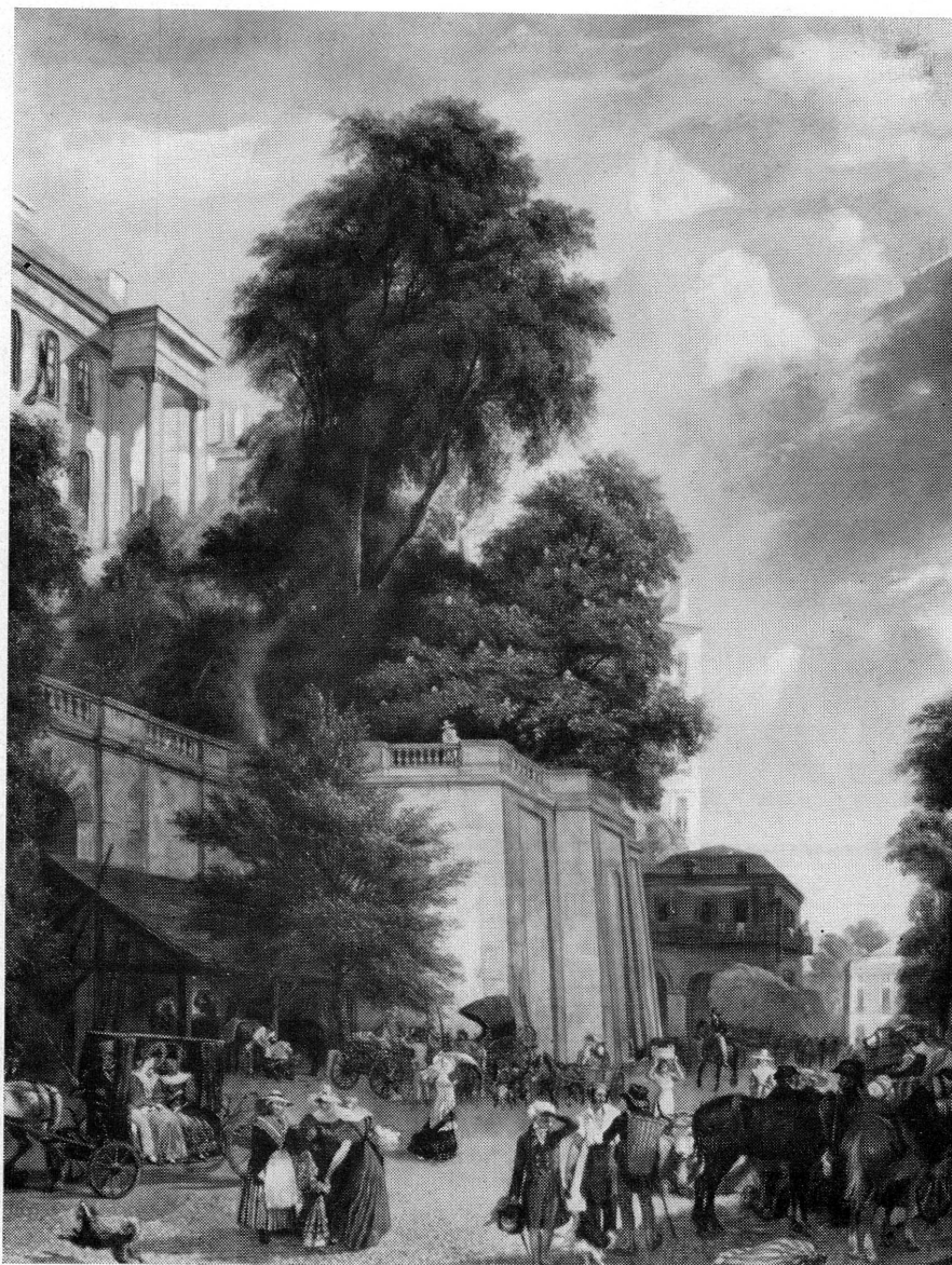
Fig. 4. — Jean-Jacques CHALON: La Corraterie , MAH 1957-20.