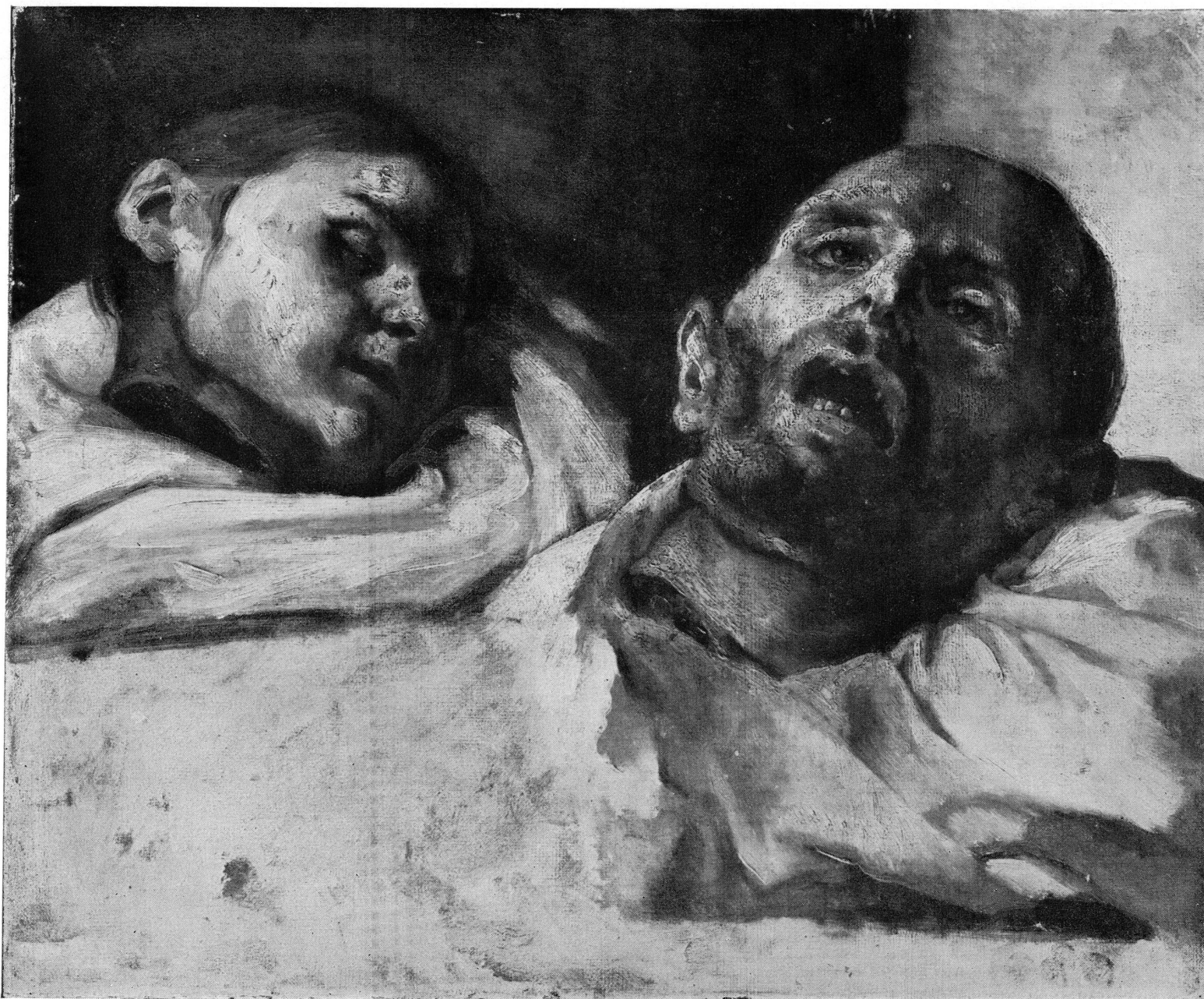
Fig. 34. — Th. GÉRICAUT : Têtes de suppliciés . Stockholm. Musée national.