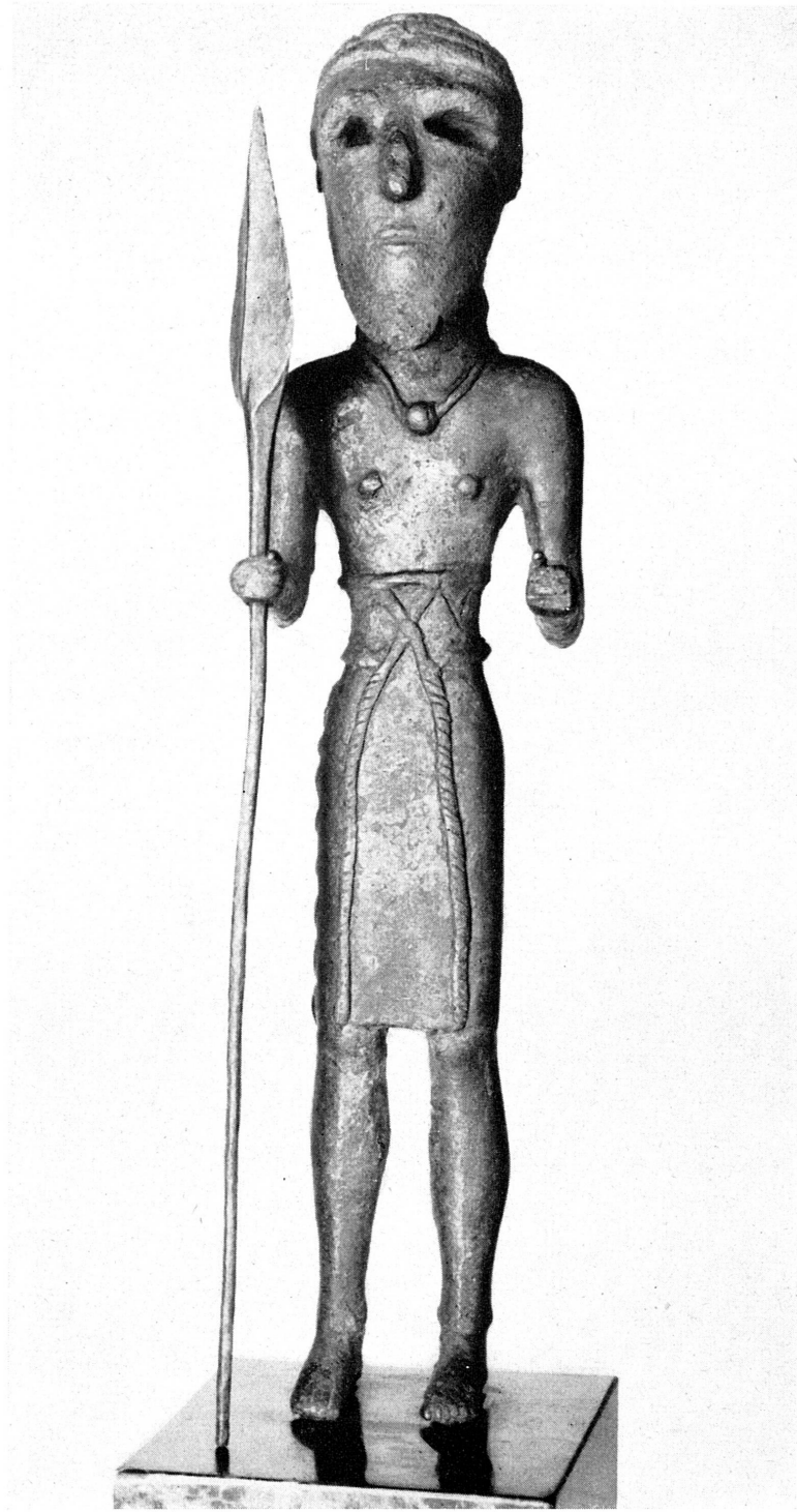
Pl. II. — Musée d'Art et d'Histoire. Statuette en bronze syro-hittite. — G, XXVII, 1949, 3, N° 18.724; Musées suisses, I, 1948, 4, fig. 1