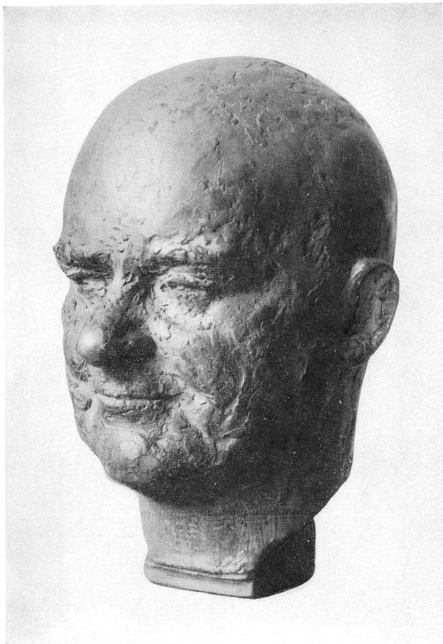
Pl. II. — P.-M. Baud. Portrait de Charles-Albert Cingria, terre cuite. Musée de Genève.