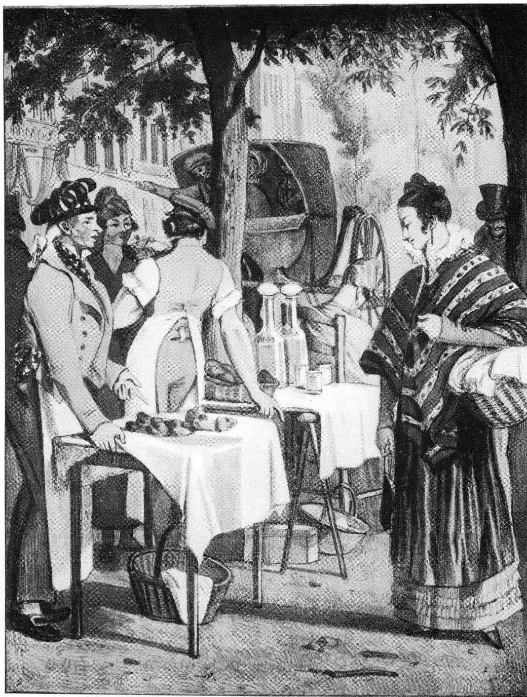
PL. III. — J.-J. Chalon, Le marchand de brioches. — Musée de Genève.