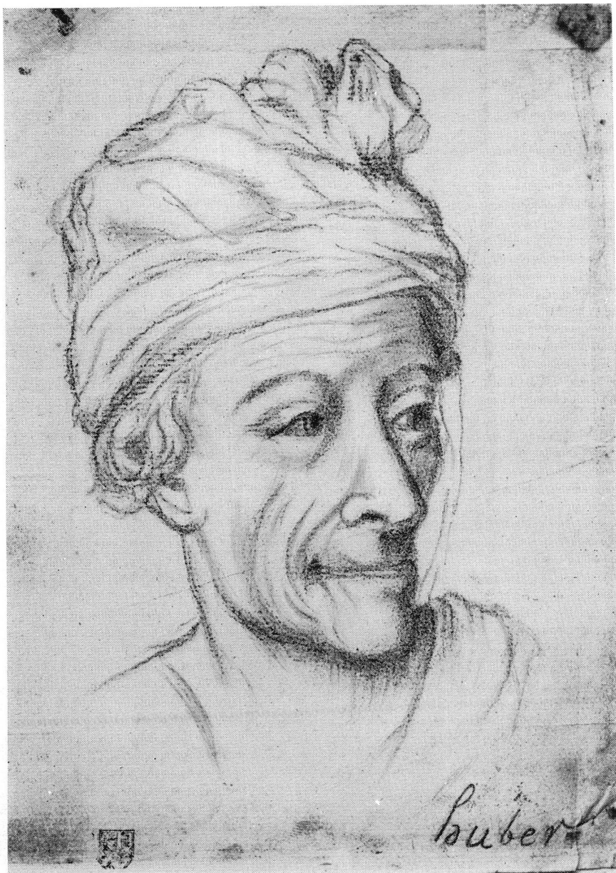
PL. IV. — Voltaire, dessin. — Genève, Musée d'Art et d'Histoire.